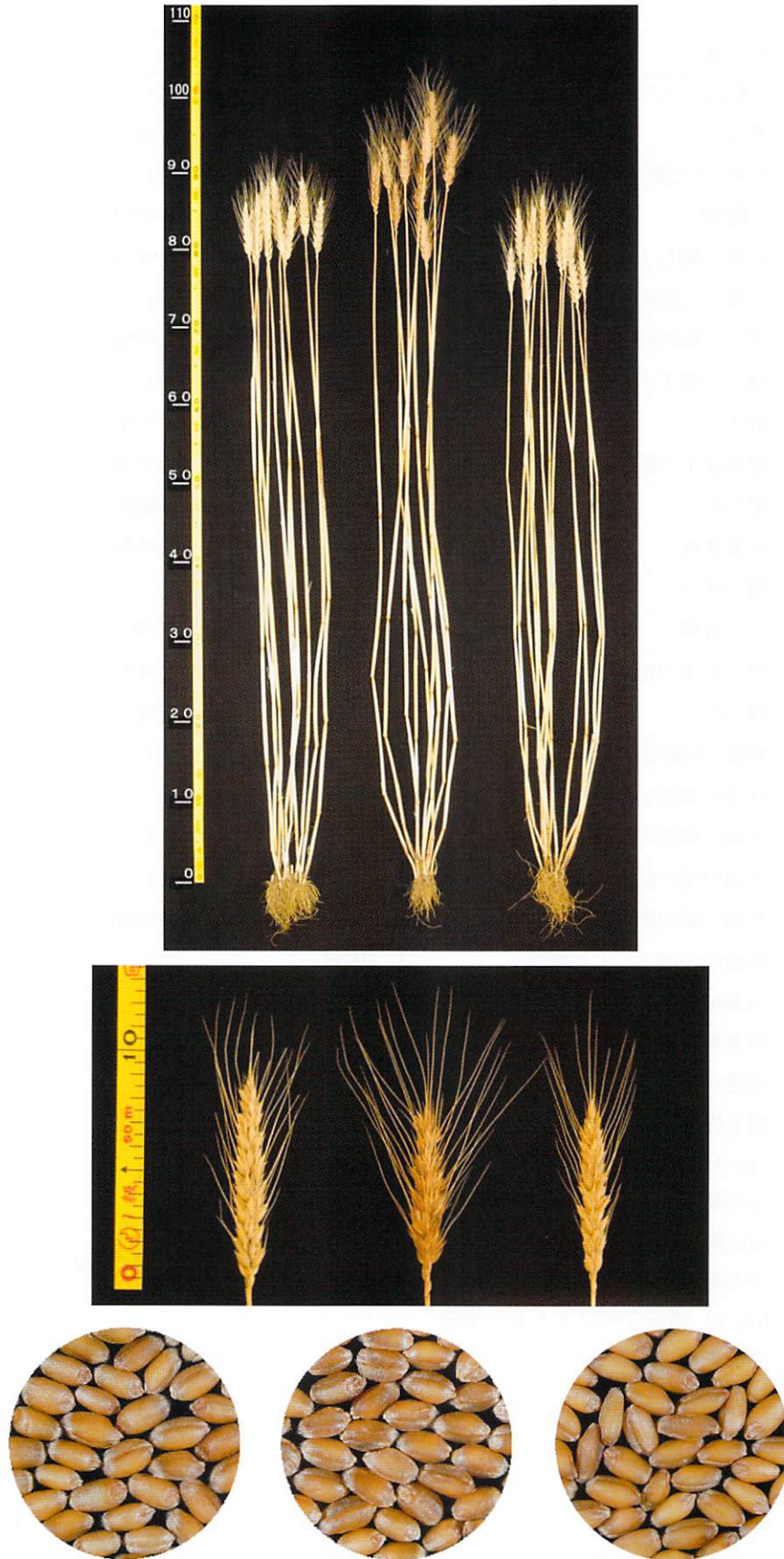
写真1 「長崎W2号」の株、穂、粒 (左:「長崎W2号」, 中:「ミナミノカオリ」, 右:「シロガネコムギ」)