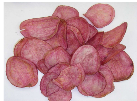
図1 「西海31号」の塊茎およびポテトチップ