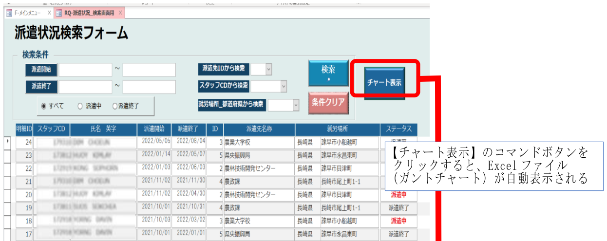
図3 派遣状況検索画面