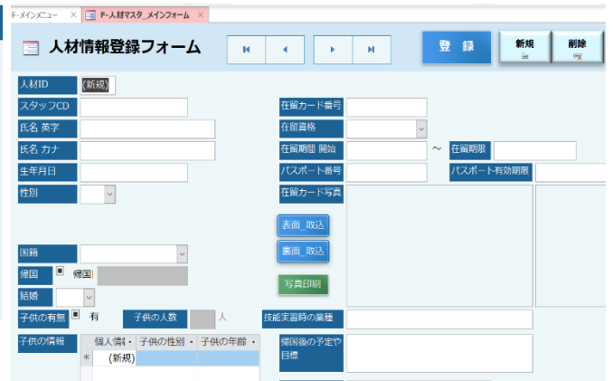
図2 外国人人材登録画面