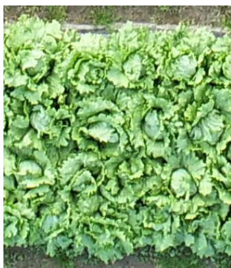
図 1-1 P4RTK 15m (0.4cm/px)