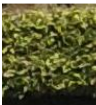
図 1-3 P4M 30m (0.8cm/px)