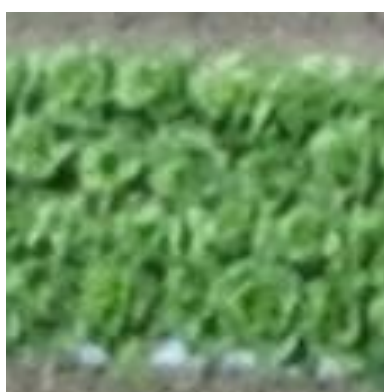
図 1-2 P4RTK 50m (1.4cm/px)