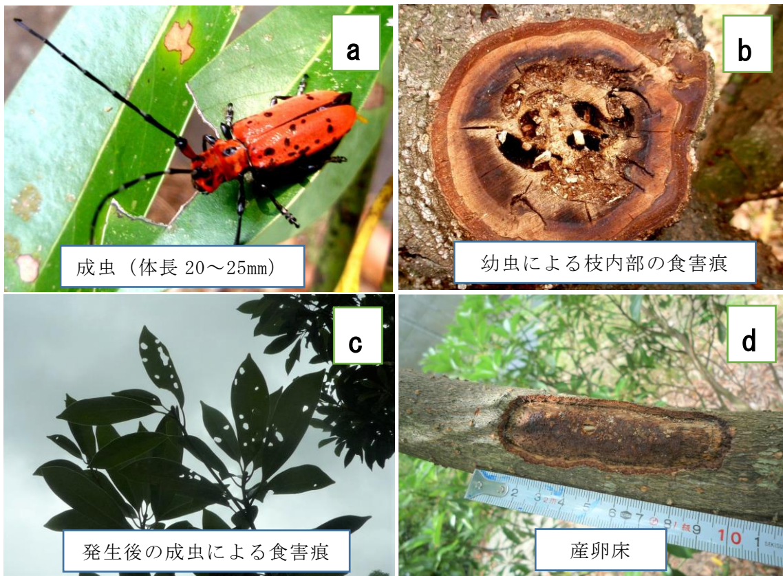
写真1 ホシベニカミキリの生態