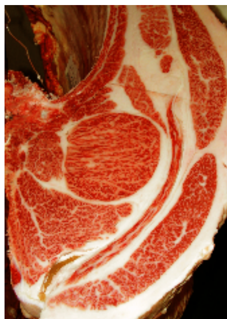
母の父/牛若丸 BMS. No. 10 母の祖父/第20平茂 ロース芯 81cm 2