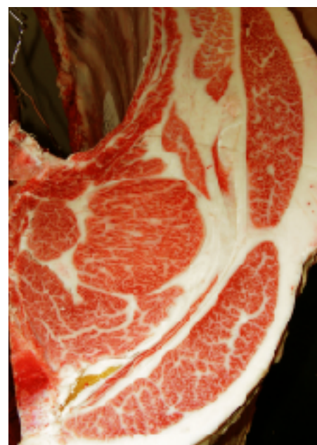
母の父/安平照 BMS. No. 11 母の祖父/糸晴 ロース芯 76cm 2