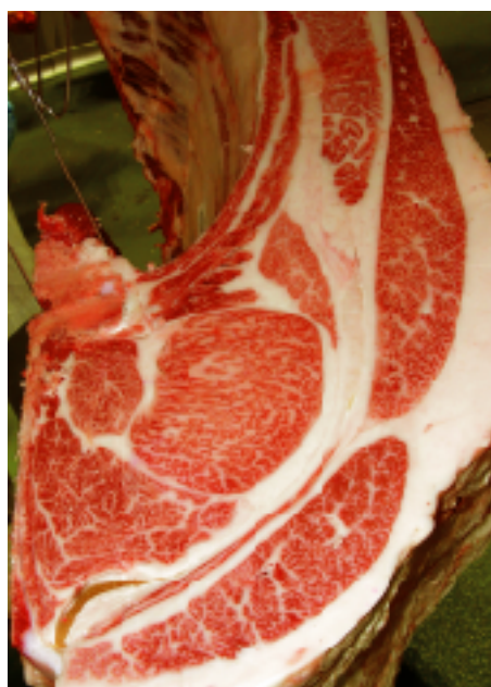
母の父/糸晴美 BMS. No. 11 母の祖父/福富 ロース芯 79cm 2