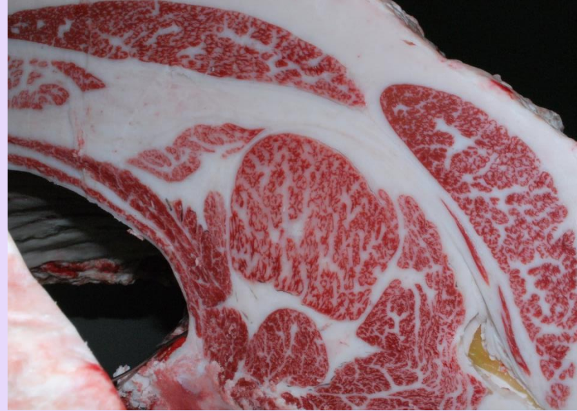
花勝国-平茂勝-康福3 BMS No.11 ロース芯 74cm 2 枝肉重量 599.1kg