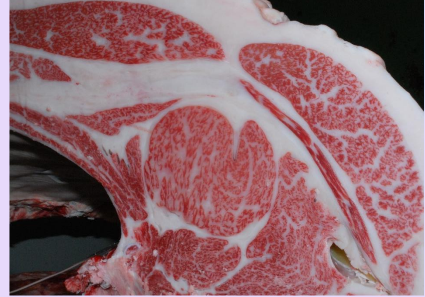
花勝国-平茂勝-康福3 BMS No.10 ロース芯 64cm 2 枝肉重量 491.5kg