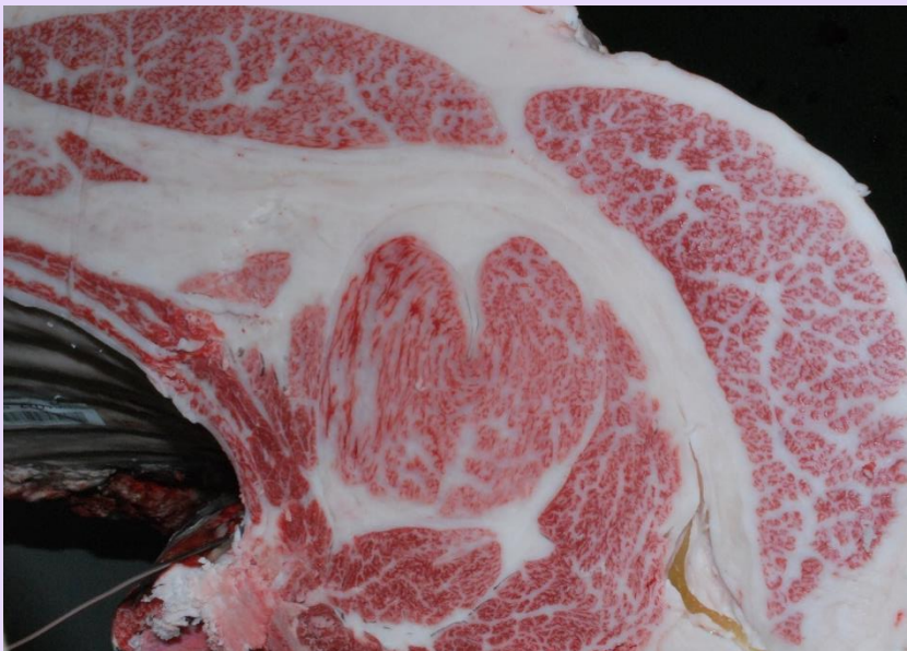
花勝国-百合茂-福之国 BMS No.12 ロース芯 77cm 2 枝肉重量 550.0kg

今後、肉質・肉量の改良を目的とした種雄牛として、本県肉用牛の改良に貢献することが期待されます。