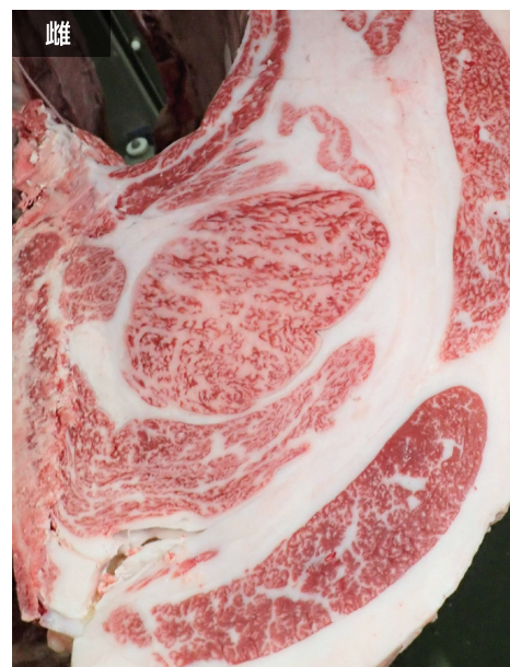
母の父/隆之国 BMS. No. 11 母の祖父/照美 ロース芯 88cm 2