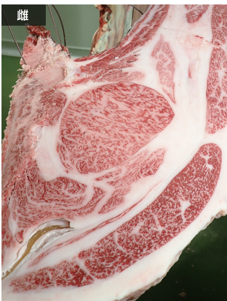
母の父/平茂晴 BMS. No. 12 母の祖父/平茂勝 ロース芯 76cm 2