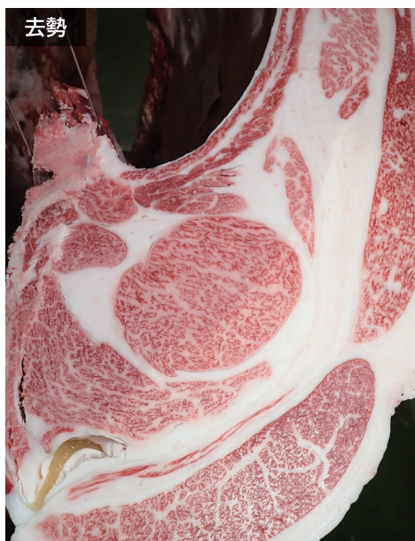
母の父/平茂晴 BMS. No. 12 母の祖父/安福久 ロース芯 73cm 2