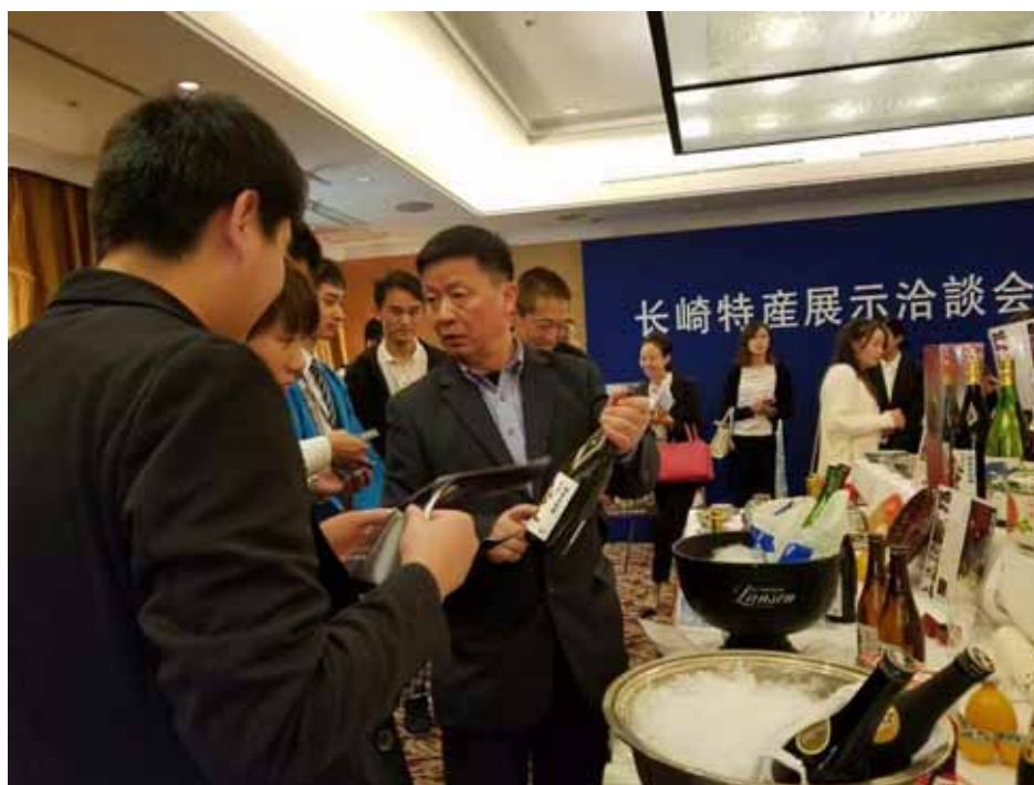
商談を行う参加者