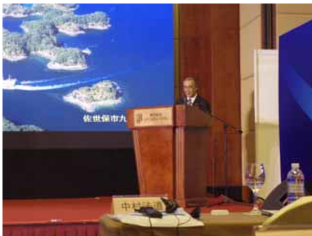
講演する中村知事