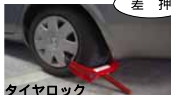
タイヤロック 差押えの事例