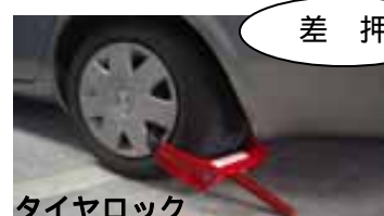
タイヤロック 差押えの事例