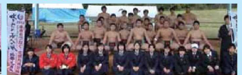
11月11日「相撲競技」長崎県新人体育大会の様子