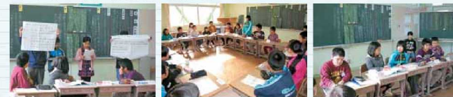
熱心に話し合う代表委員会の児童

本年度3回目の代表委員会で、「いじめのない明るい学校づくりのために、私たちにできること」をテーマに、3年生以上の学級と専門委員会の代表者が熱心に話し合いました。