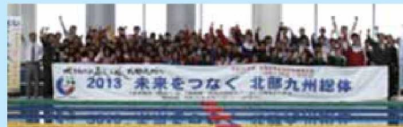
10月13日「水泳競技」全九州高校選手権新人大会の様子

長崎県高校生活動推進委員会では、県内のカウントダウンイベント「応援メッセージリレー」を実施しています。生徒委員が、各競技大会や街頭で応援メッセージや広報グッズを配布するなど、北部九州インターハイのPR活動を行っています。今後も、各種大会や様々なイベント等で積極的に広報活動をし、おもてなしの心で「長崎の魅力」を発信していきます。