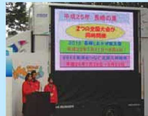
長崎県高校生活動報告の様子

また、本年度の北信越総体の運営に携わった高校生の方々から、友情の花の種を受け継ぎました。インターハイ成功の願いがこめられた花を長崎で美しく咲かせたいと思います。