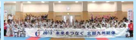
10月20日「空手道競技」長崎県新人体育大会の様子