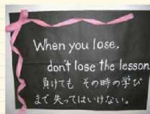
FPKO委員会が作成した掲示物

「いじめチェック表」には、次のような項目を設けています。FPKO委員は、この項目を基に毎月点検し、学級の状況をつかおうがかりにしています。