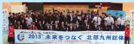
11月11日「ウエイトリフティング競技」長崎県新人体育大会の様子