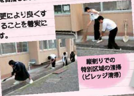
縦割りの特別区域の清掃(ピレージ清掃)

今年度から取り組んでいる「郡中美礼時」は、伝統ある郡中を更により良くするためにとてもいい目標だと思います。1年目の今年度は、できることを着実に実践しながら、郡中の特色として軌道に乗せたいと思っています。どのような活動ができるかを話し合いながら進めていますが、母校の新たな伝統づくりに携わり、とてもやりがいを感じています。今後は、この活動を生徒の手で定着させ、地域の人に信頼され、在校生も、卒業生も誇りに思える学校にしたいと考えています。