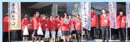
11月3日長崎市内の商業施設玄関前でのPR活動