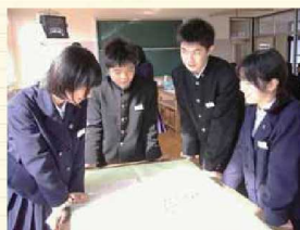
FPKO委員会の話し合い