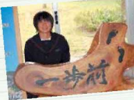
車椅子を贈るため空缶缶に取り組み中です。今後も、この憲章に励まれているように、この岐宿から日本、そして世界に目を向けていきたいと思います。

現在、私たちは、先輩から受け継いだこの憲章と、それを具現化したい「あなたに任せよう」という取組を更に充実させたいという思いから、校内生活の向上はもちろん、きれいな花を育て、校門前を花で一杯にしたり、障害のある方に