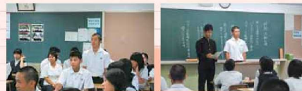
具体的な取組を話し合う風紀委員

長崎南高生が、バス乗車時に地域の方に迷惑をかけることはもちろんのこと、地域の方にも率先して挨拶をするなどして、地域に明るい雰囲気をつくっていきたくて思っています。また、校内でも、全校生徒が明るく有意義な日々を送ることができるよう、私たち風紀委員が思いを同じくして日々の実践を重ねていきたいと思います。