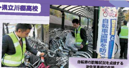
自転車の駐輪状況を点検する波佐見高校の生徒

川棚駅の駐輪場は、多くの方が利用されています。このような公共の場所を地域の方と一緒に、快適に利用できるように駐輪や施設の状況を点検したり、環境整備を行ったりしています。多くの生徒が、マナーを守る意識を高めてほしいと願っています。