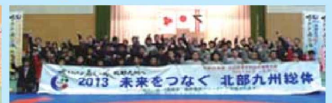
11月17日「レスリング競技」長崎県新人体育大会の様子