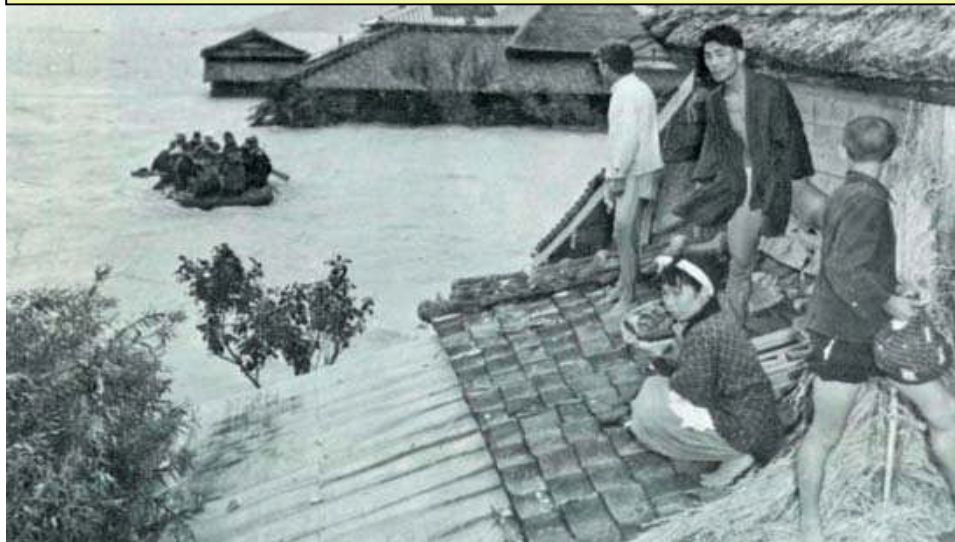
図-3 昭和32年諫早大水害に遭い屋根で救助を待つ住民