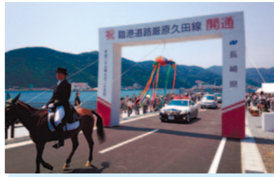
臨港道路厳原久田線 対馬市 厳原港の南北の埠頭を結ぶことにより、水産物などの円滑な輸送と既存道路のバイパスとしての安全な通行を確保しました。