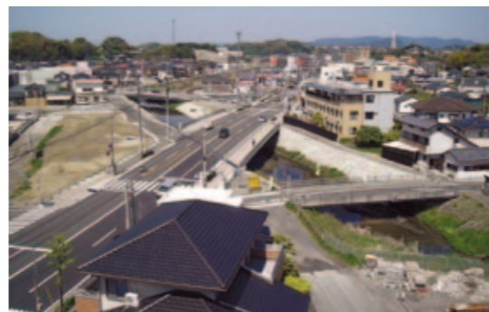
日野川河川改修(総合流域防災事業) 佐世保市 河川改修が進んだことにより、下部の浸水被害の軽減が図られました。