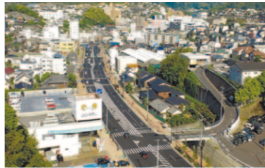
都市計画道路滑石町線(横道工区) 長崎市 現道の2車線を4車線に拡幅したことにより、通勤時間帯の渋滞が緩和されました。