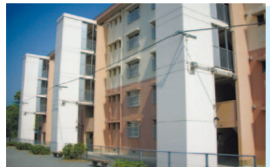
県営住宅(毛井首団地) 長崎市 エレベーター付きのバリアフリー改善工事を行うことによって、高齢者にも安心して住んでいただける住戸となりました。