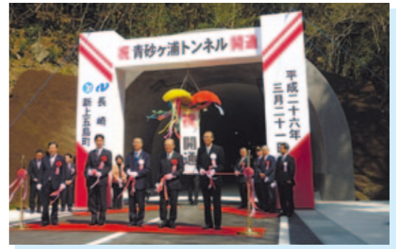
青砂ヶ浦トンネル(主要地方道有川新魚目線) 新上五島町 上五島における北部地域への交通の利便性が向上しました。