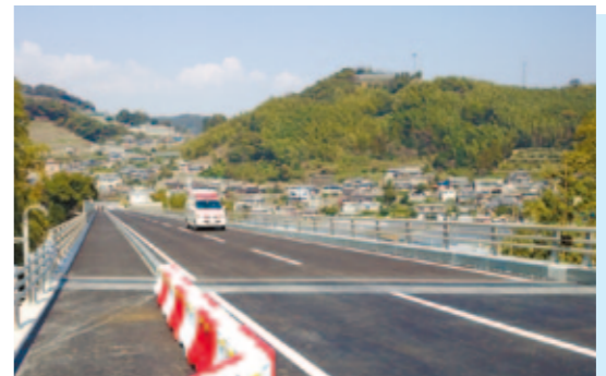
飯香浦区【片峰橋】(主要地方道野母崎宿線) 長崎市 長崎市東部における、消防・救急活動への支援が期待されます。