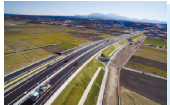
愛野森山バイパス(国道251号) 雲仙市・諫早市 地域高規格道路「島原道路」の一部であり、所要時間が約3分短縮されるとともに、国道251号の愛野交差点で発生している慢性的な交通混雑が解消されました。