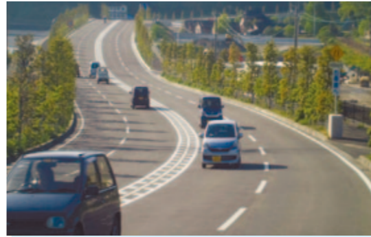
都市計画道路相浦棚方線 佐世保市 旧県道は狭小で見通しも悪く慢性的な渋滞が発生していましたが、バイパスが完成したことにより渋滞が緩和され、移動時間も短縮されました。