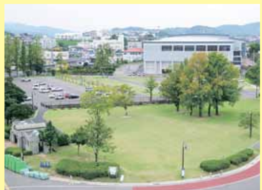
公共デザイン推進制度活用事例 (県立総合運動公園における駐車場及び緑地)

地域景観に影響を与える可能性が高い大規模な建築物・工作物や開発行為等について、景観法に基づく届出制度を活用し、規制・誘導を行います。