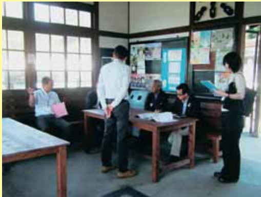
アドバイザー派遣の様子

住民や市町、県が行う美しい景観形成を目指した地域づくりや施設整備等に対し、専門家を派遣して、技術的支援を行います。