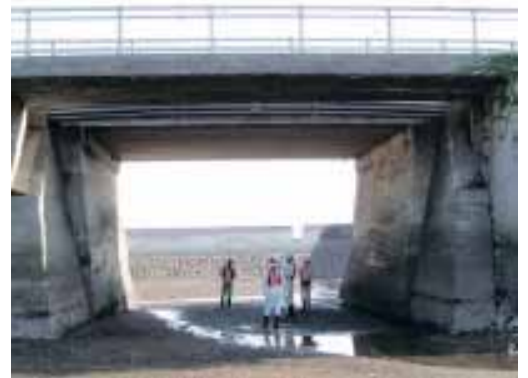
橋梁の定期点検状況

長崎県では、不具合が生じてからの補修ではなく、「 予防保全的手法 」を導入した効率的かつ計画的な維持補修を行うための維持管理計画を策定し、施設の延命化とライフサイクルコストの縮減を図り、次世代に社会資本を引き継ぎます。