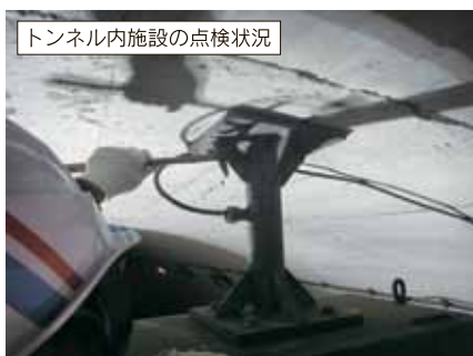
トンネル内施設の点検状況

長崎県が管理するトンネル130本について、平成27年3月に改訂した「長崎県トンネル維持管理計画」により、効率的な維持管理・補修工事を行い、トンネルの長寿命化と維持管理コストの平準化・最小化を目指します。