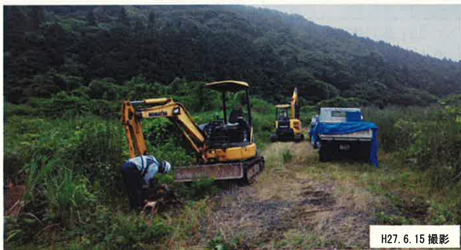
H27. 6. 15 撮影

付替県道は、地域の生活道路としても必要な道路であり、さらには、この道路の完成を前提に代替墓地に移転していただいている方もおられることから、早期完成・供用を目指しています。