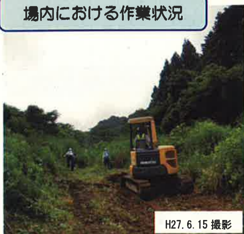
H27. 6. 15 撮影