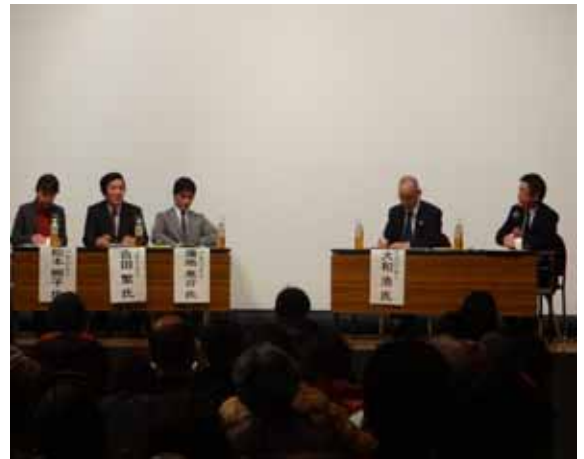
ディスカッション