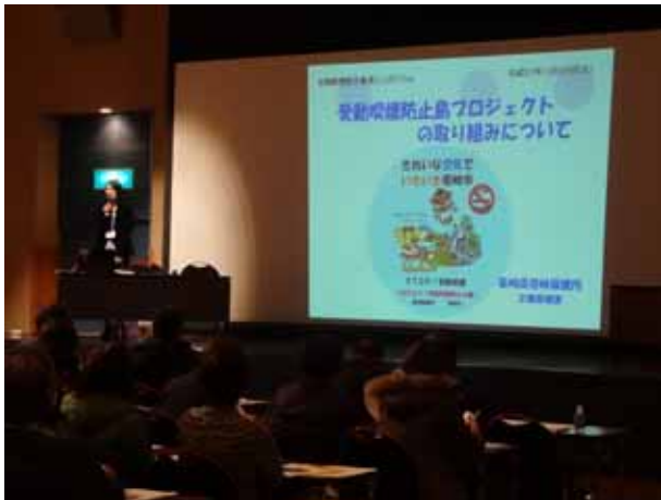
保健所の取り組み報告