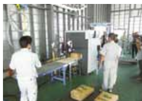
福島県産米は全袋検査しています