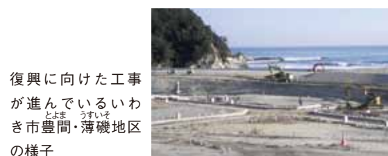
復興に向けた工事が進んでいるいわき市豊間・薄磯地区の様子