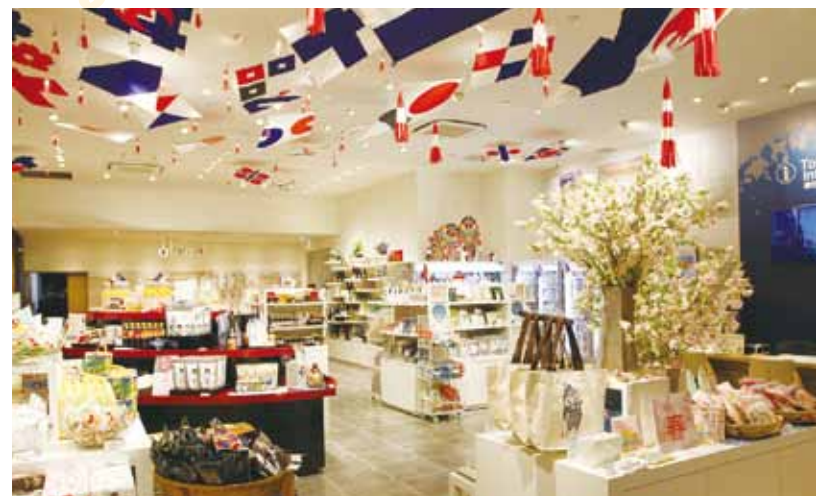
オフィス街のOLや本物志向のシニア層をターゲットに、県産品だけでなく旬の観光情報など本県の魅力を発信します