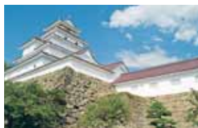
鶴ヶ城(会津若松市)