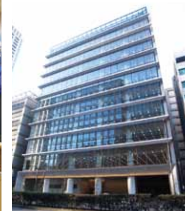
「日本橋 長崎館」の入っているアーバンネット日本橋二丁目ビル

3月7日、東京・日本橋にオープンした「日本橋 長崎館」。「首都圏と地元の人・物・情報の交流を活性化することで“地域を元気にする”」を基本コンセプトに、定番の商品や観光地だけではなく長崎の魅力を発信する新たな拠点です。