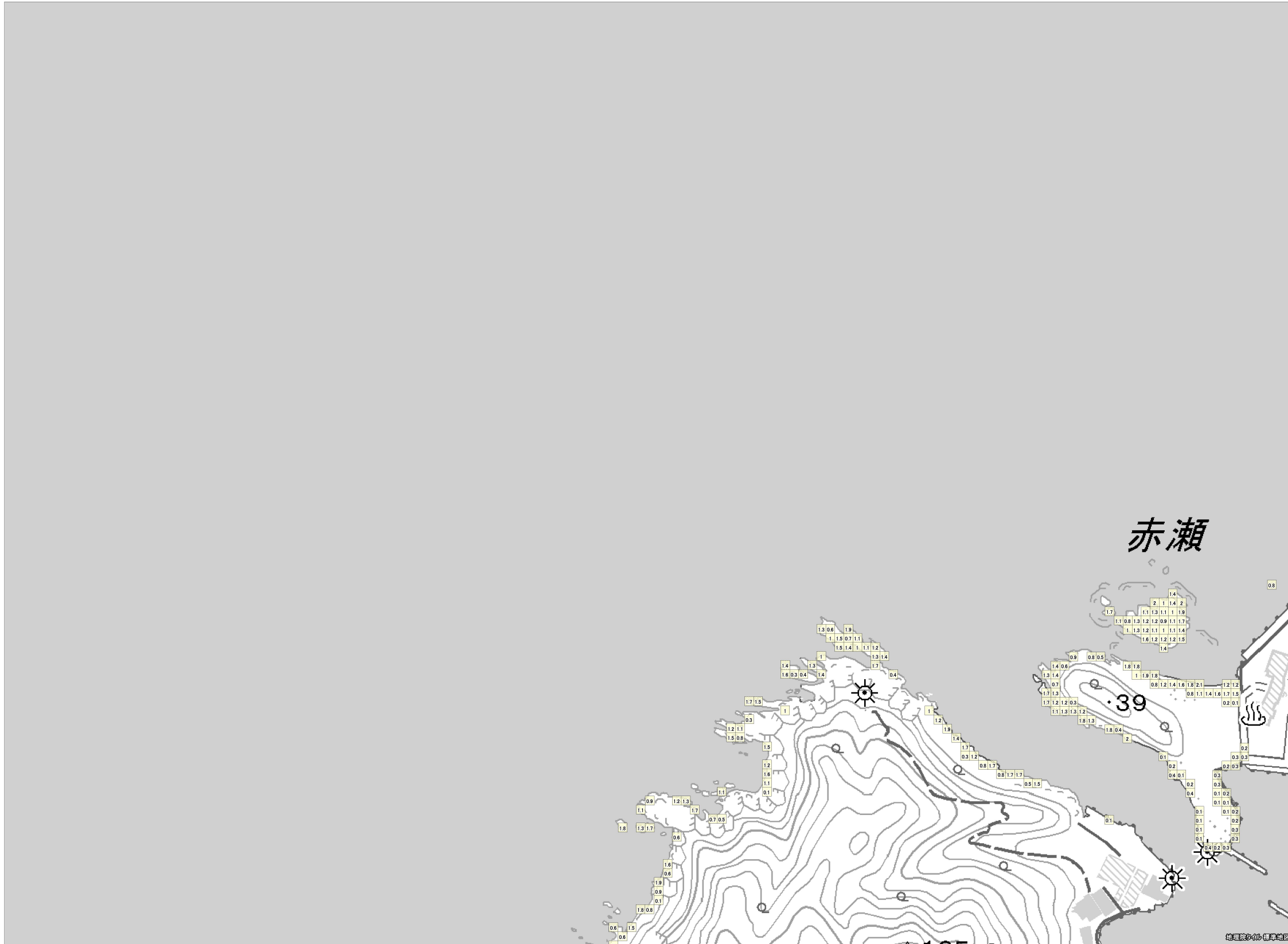
この地図は、国土地理院長の承認を得て、同院発行の電子地形図（タイル）を複製したものである。（承認番号 平 27 情複、第 1413 号）これをさらに複製又は使用して配付する場合には、国土地理院の長の承認を得なければなりません。