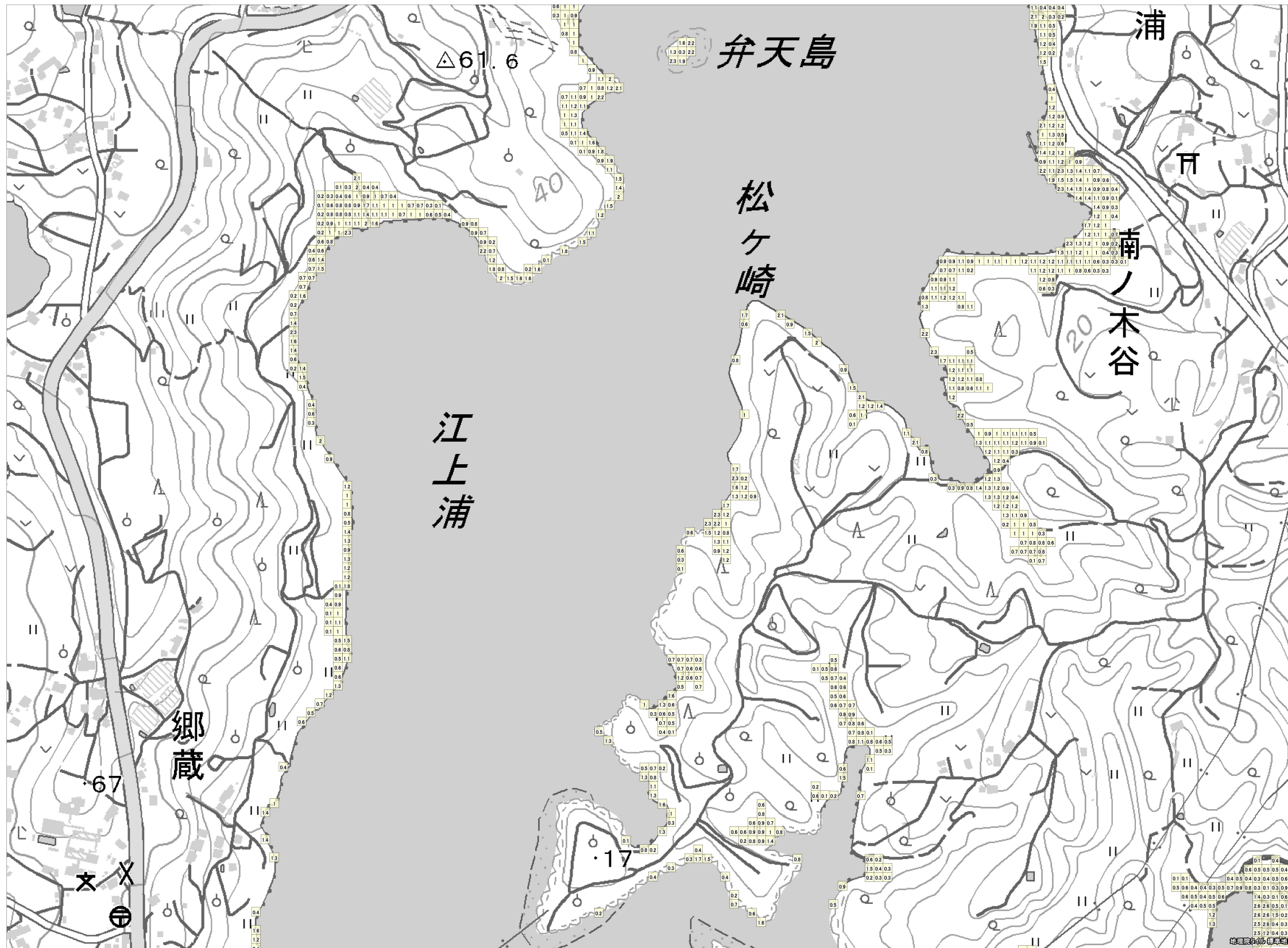
この地図は、国土地理院長の承認を得て、同院発行の電子地形図（タイル）を複製したものである。（承認番号 平 27 情複、第 1413 号） これをさらに複製又は使用して配付する場合には、国土地理院の長の承認を得なければなりません。