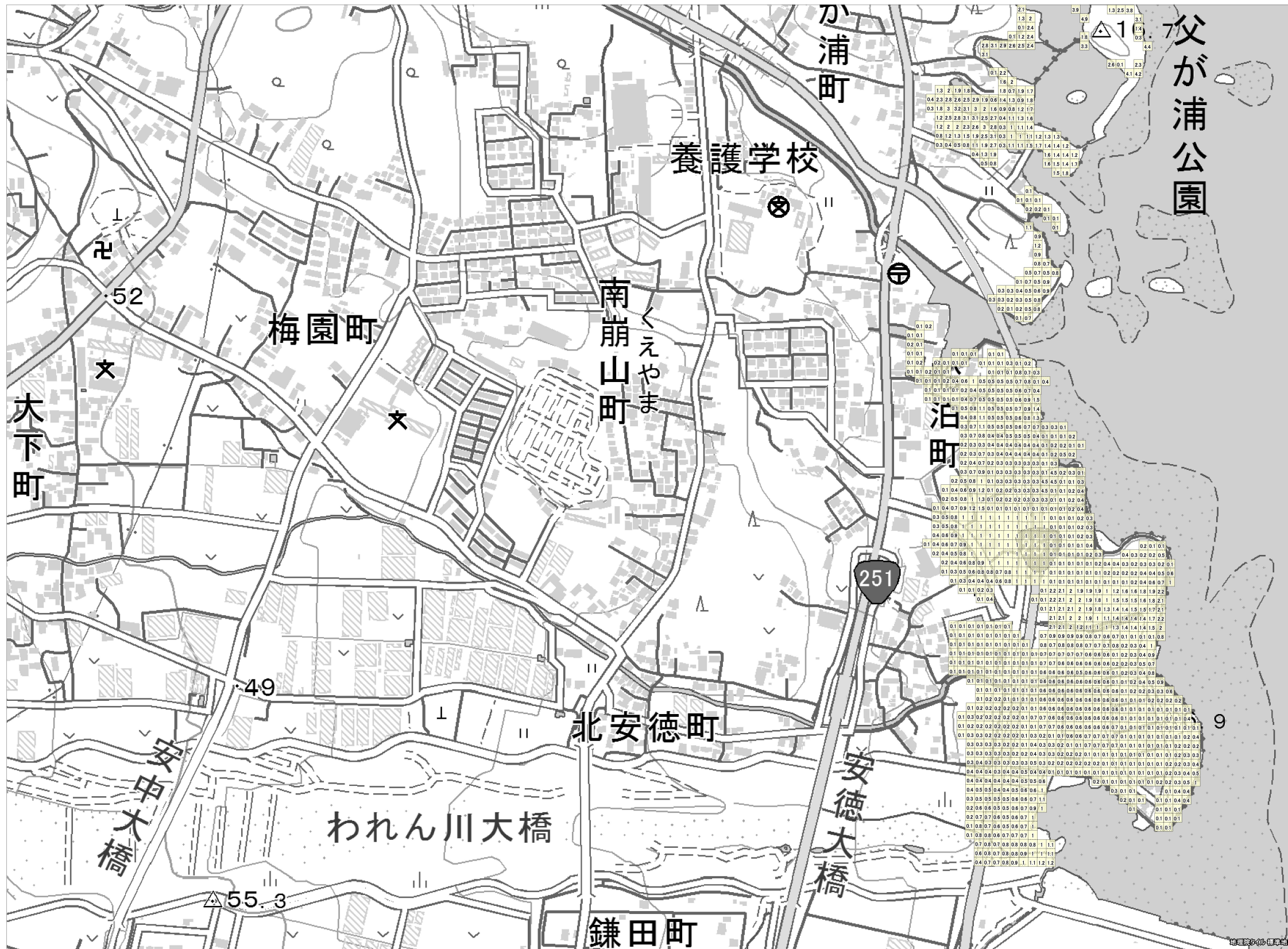
この地図は、国土地理院長の承認を得て、同院発行の電子地形図（タイル）を複製したものである。（承認番号 平 27 情複、第 1413 号） これをさらに複製又は使用して配付する場合には、国土地理院の長の承認を得なければなりません。