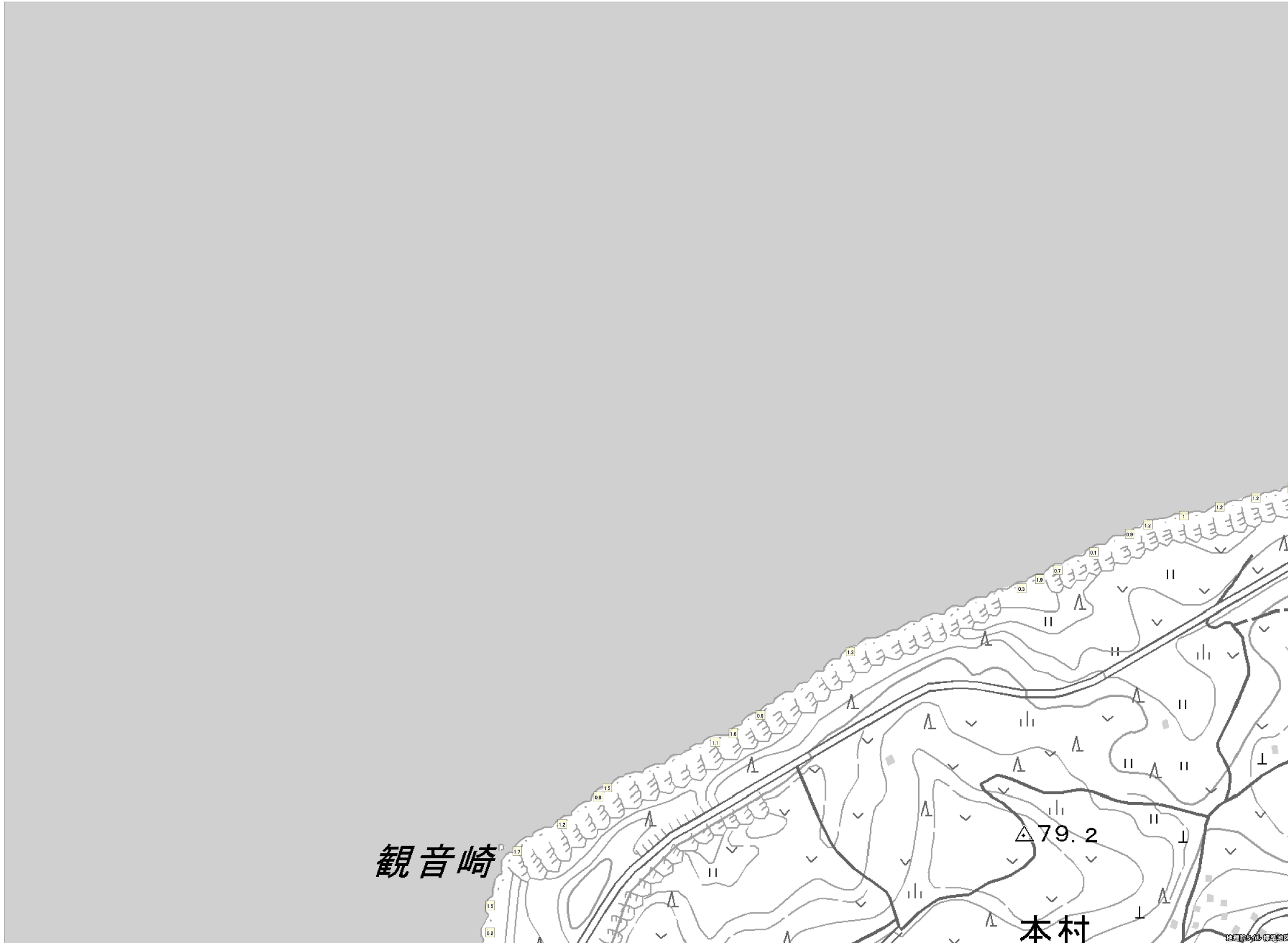
この地図は、国土地理院長の承認を得て、同院発行の電子地形図（タイル）を複製したものである。（承認番号 平 27 情複、第 1413 号） これをさらに複製又は使用して配付する場合には、国土地理院の長の承認を得なければなりません。