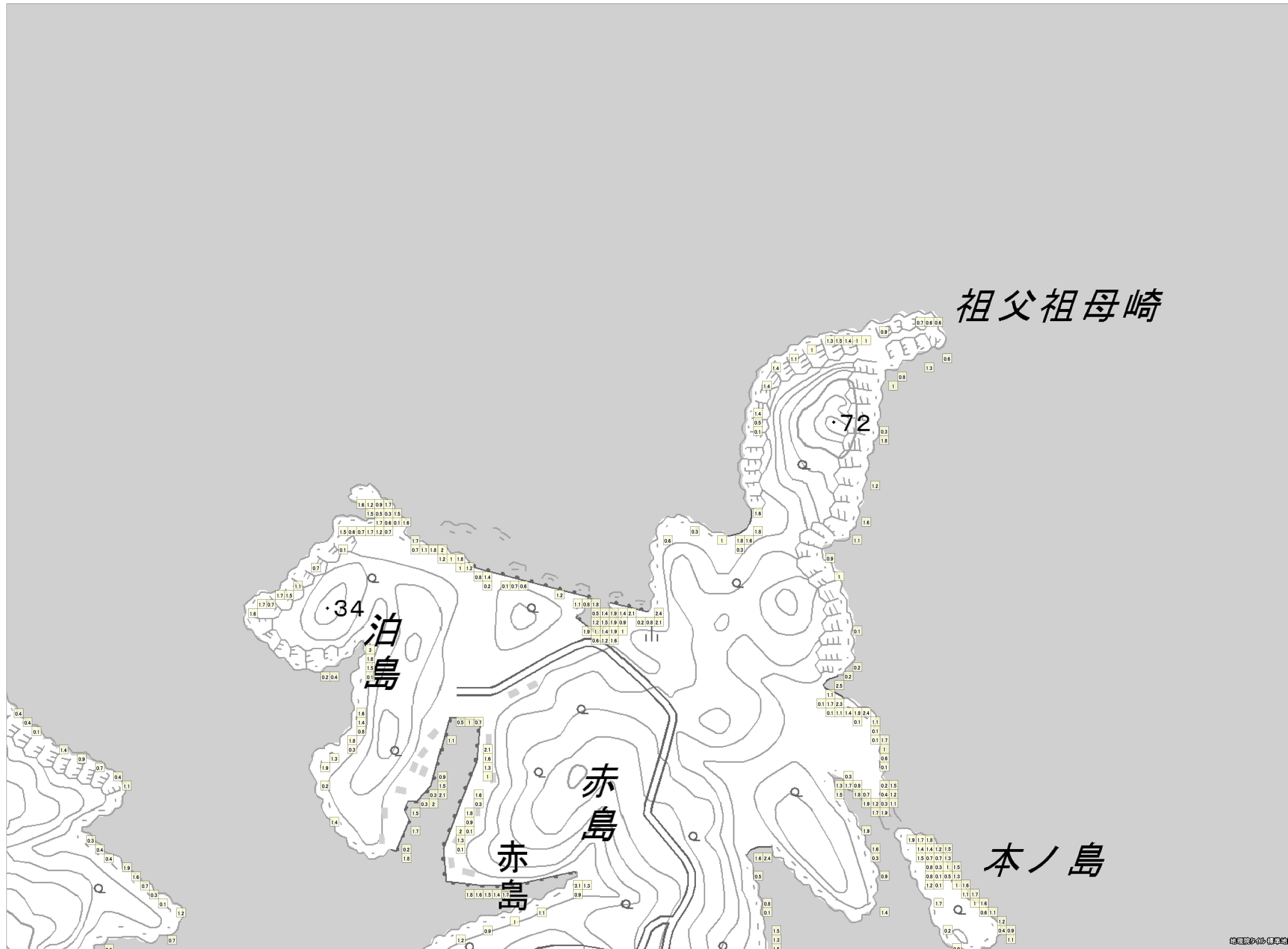
この地図は、国土地理院長の承認を得て、同院発行の電子地形図（タイル）を複製したものである。（承認番号 平 27 情複、第 1413 号）これをさらに複製又は使用して配付する場合には、国土地理院の長の承認を得なければなりません。