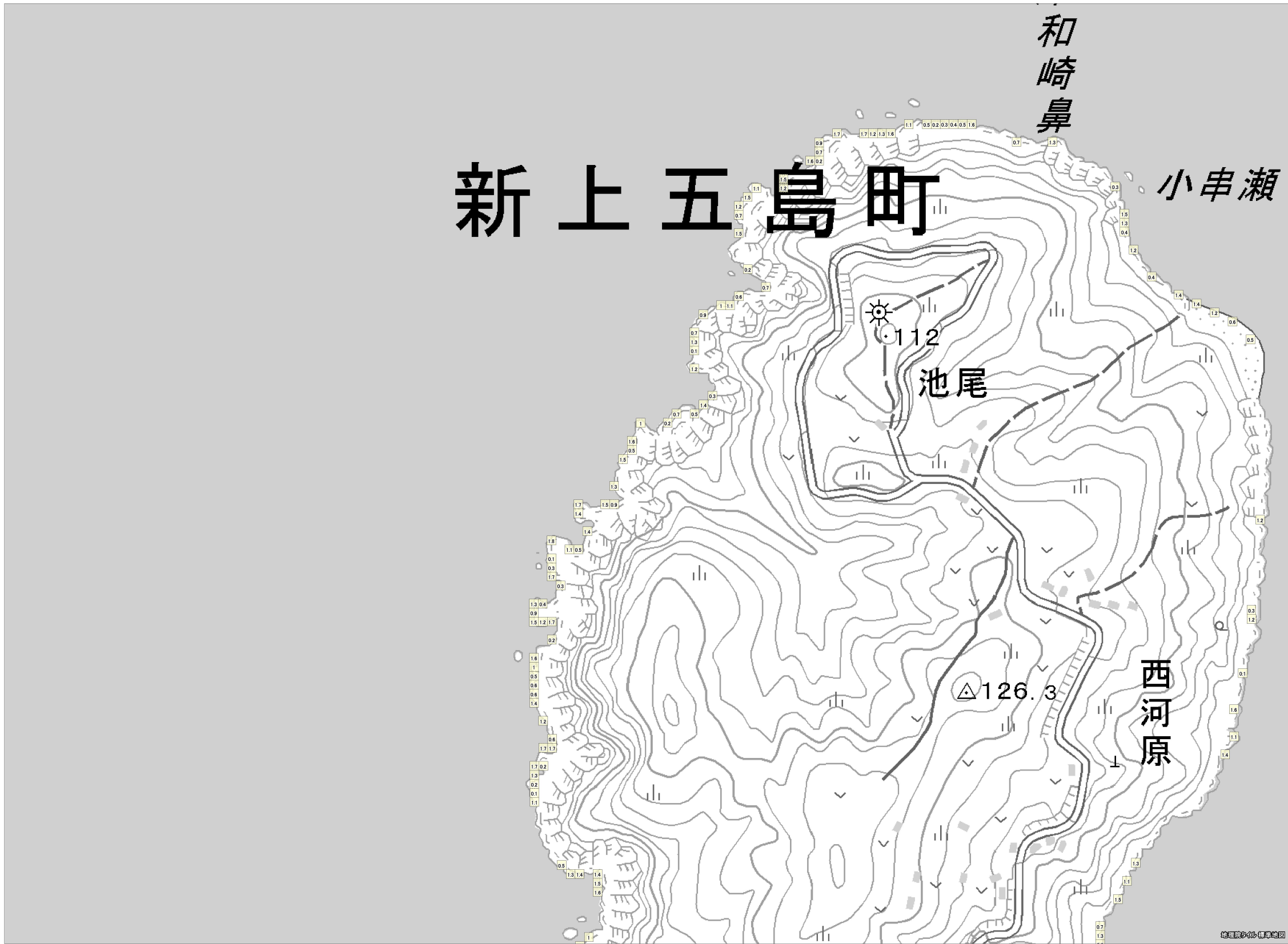
この地図は、国土地理院長の承認を得て、同院発行の電子地形図（タイル）を複製したものである。（承認番号 平 27 情複、第 1413 号）これをさらに複製又は使用して配付する場合には、国土地理院の長の承認を得なければなりません。