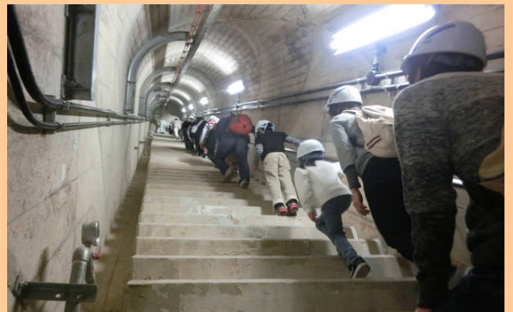
長く急な階段でしたが、みんな歩き通すことができました！