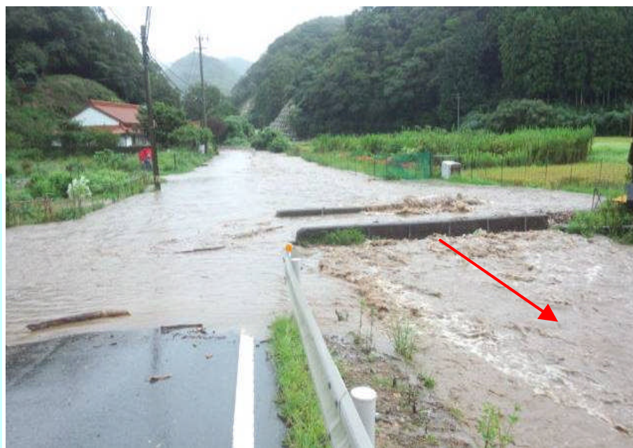
大雨により流域内の道路や家屋が浸水した田川(対馬市・豊玉町)

今年、台風が北海道に3つ上陸し、また、東北地方太平洋側にも上陸して甚大な被害をもたらしましたが、気象庁によれば、このようなことは1951年の統計開始以来、初めてのようです。