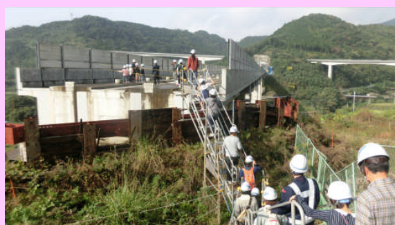
橋の完成後は登ることができない場所なので、皆さんの良い思い出になったようです。