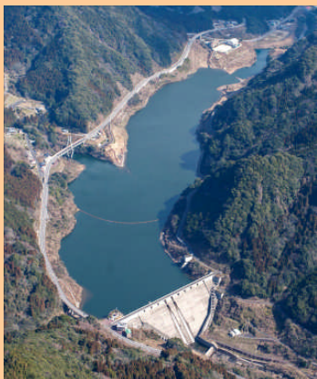
昭和37年、 県内初 の多目的ダムとして建設され、平成13年には 県内初 の嵩上げを実施