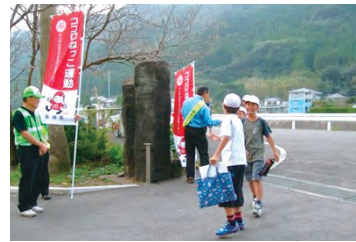
身近にできるあいさつ運動

子どもたちが他人を思いやる心を身に付けられるよう、県民総ぐるみでココロねっこ運動を実践しましょう！