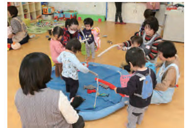
おもちゃがたくさんあり、親子で楽しく遊べます

「スタッフの方が親身になって話を聞いてくれるし、親も子どもも友達ができて楽しいので、とても助かっています」と利用者の方も笑顔満開でした。