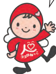
「ココロねっこ運動」 イメージキャラクター 『ココロンちゃん』

家庭だけでなく地域全体で、 子どもと子育て家庭を支える 気持ちを持つことが大切です。