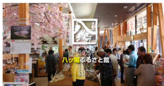
ハッ場ふるさと館

水没移転者の要望によりつくられた道の駅ハッ場ふるさと館は、土日は駐車場が満杯になるほどの人で賑う。今年4月には第二駐車場がオープンするほどに。