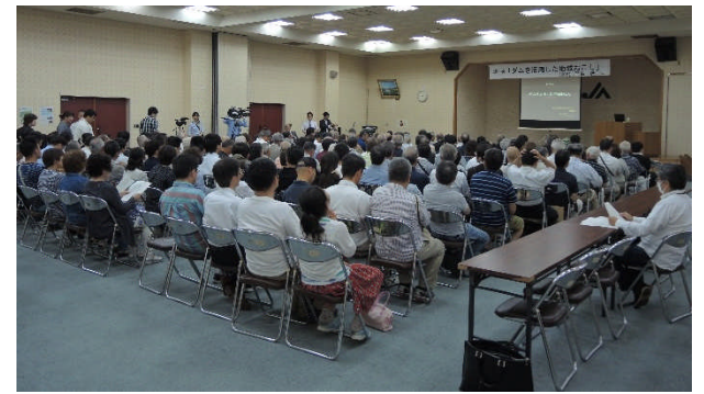
会場は約250名もの方々で埋め尽くされました