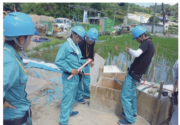
～型枠大工養成講座の様子～ 担い手の確保・育成に取り組めます