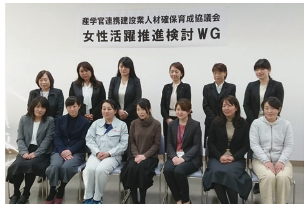
～女性活躍推進検討WGの様子～