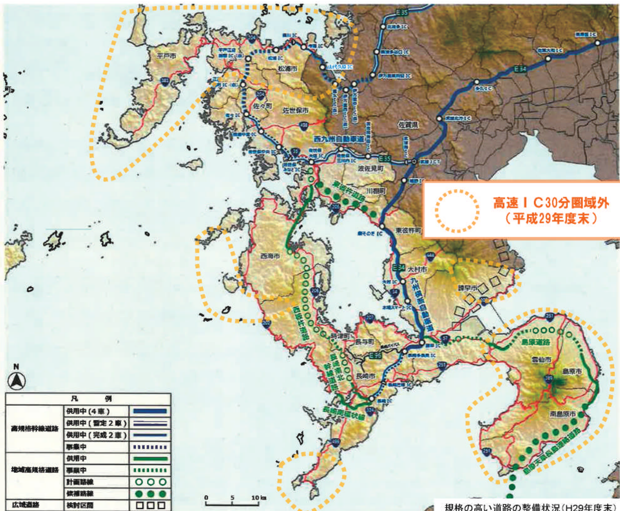
規格の高い道路の整備状況(H29年度末)