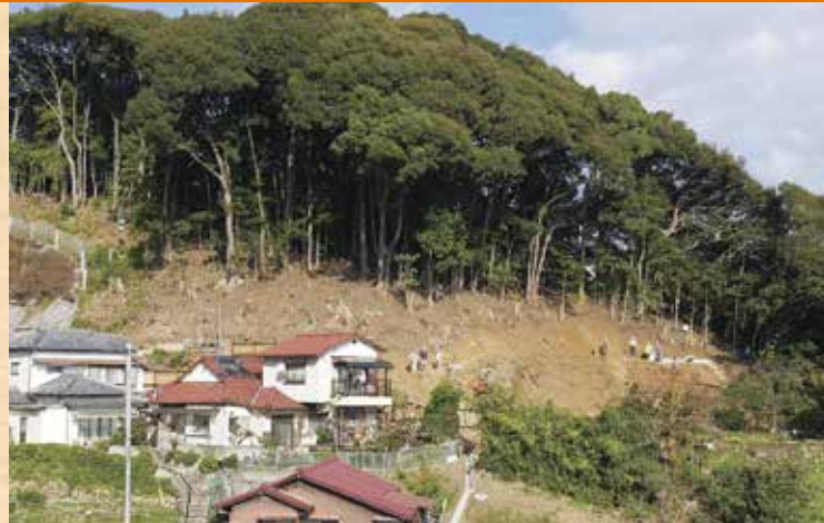
木が茂っていたところを綺麗に除去して、今後法面が作られる(石坂(2)地区)。