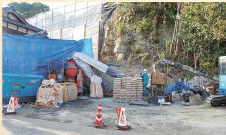
コンクリートを送っている場所。この現場はこういうスペースが近くに取れたことが幸運だったようだ(大和(8)地区)。