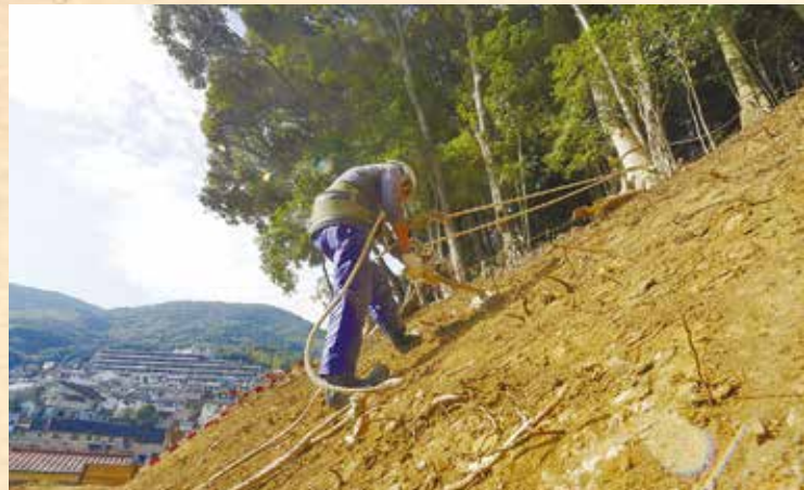
こうしてロープで吊られながら鍬のような用具を使い木の根を除去していた(石坂(2)地区)。