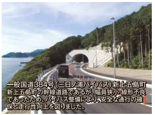
一般国道384号(三日ノ浦バイパス)新上五島町 新上五島町の幹線道路であるが、幅員狭小、線形不良 であったため、バイパス整備により、安全な通行の確 保と走行性向上を図りました。