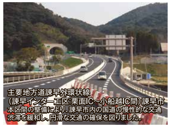
主要地方道諫早外環状線 (諫早インター工区:栗面IC～小船越IC間)諫早市 本区間の整備により、諫早市内の国道の慢性的な交通 渋滞を緩和し、円滑な交通の確保を図りました。