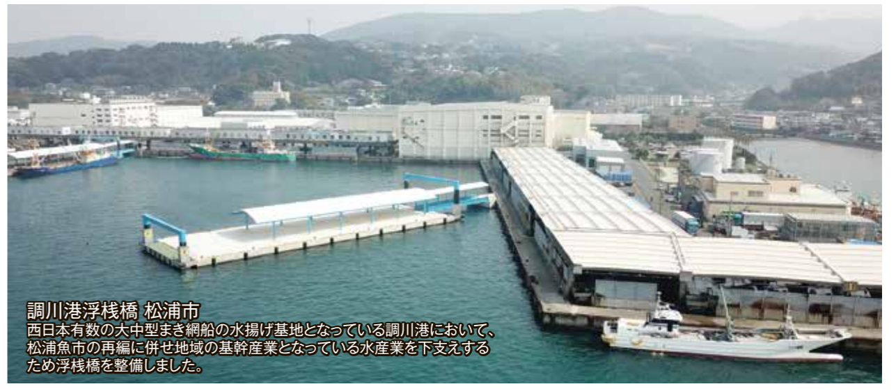
調川港浮棧橋 松浦市 西日本有数の大中型まき網船の水揚げ基地となっている調川港において、 松浦魚市の再編に併せ地域の基幹産業となっている水産業を下支えする ため浮棧橋を整備しました。