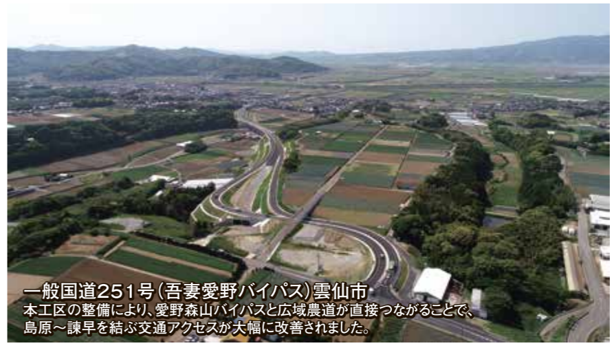
一般国道251号(吾妻愛野バイパス)雲仙市 本工区の整備により、愛野森山バイパスと広域農道が直接つながることで、 島原～諫早を結ぶ交通アクセスが大幅に改善されました。