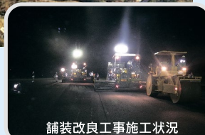
舗装改良工事施工状況

対馬空港では、平成25年から滑走路舗装改良工事と照明施設更新工事を行っており、平成32年度に完了予定です。