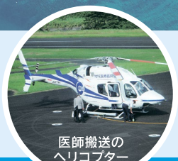
医師搬送のヘリコプター

上五島空港、小値賀空港は、平成18年に定期便は休止されましたが、急患搬送や医師搬送のヘリコプター発着に利用されており、離島医療に貢献しています。