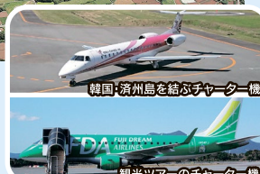
韓国・済州島を結ぶチャーター機

福江空港では、静岡空港や小牧空港などからの観光ツアーのチャーター便の利用が年間20回程度あります。平成30年度は韓国・済州島を結ぶチャーター便も運航しました。