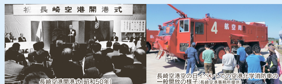
長崎空港開港式(昭和50年)