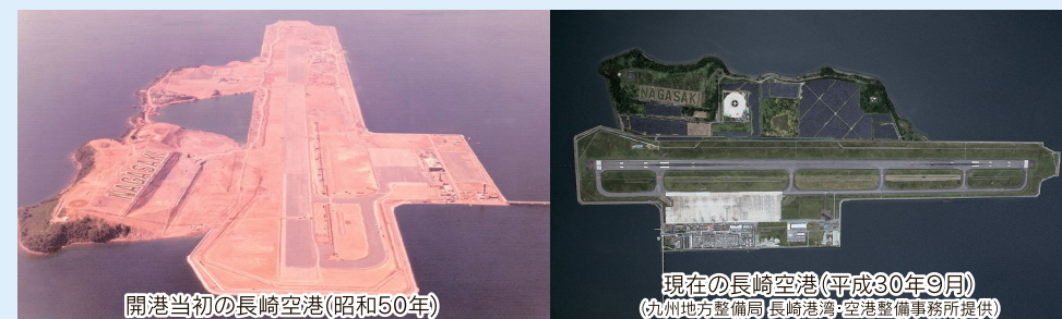
開港当初の長崎空港(昭和50年)

空港西側には、ツツジやサツキで「NAGASAKI」を表した花文字山があり、空港利用者を出迎えています。平成28年には一般家庭の約7500世帯分の電力を発電するメガソーラー発電所も稼働しました。また、毎年秋には、飛行機の機体見学など親子で楽しめる「空の日」フェスタが開催されています。