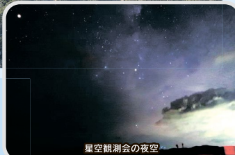
星空観測会の夜空

上五島空港では、10月に新上五島町主催の星空観測会が行われ、70人の一般参加者が集まりました。