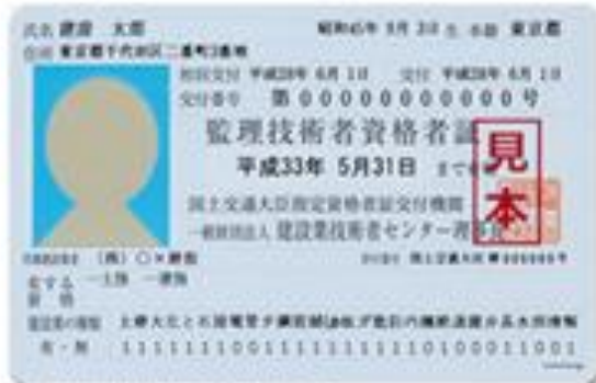
監理技術者資格者証（表面）