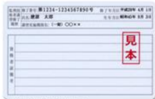
監理技術者資格者証（裏面）