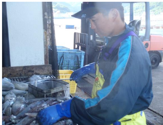
慣れた手つきで水イカの墨抜き