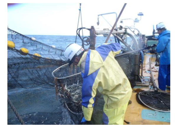
活かして高値で販売