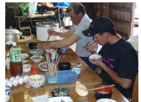
獲れたばかりの魚を使った朝食