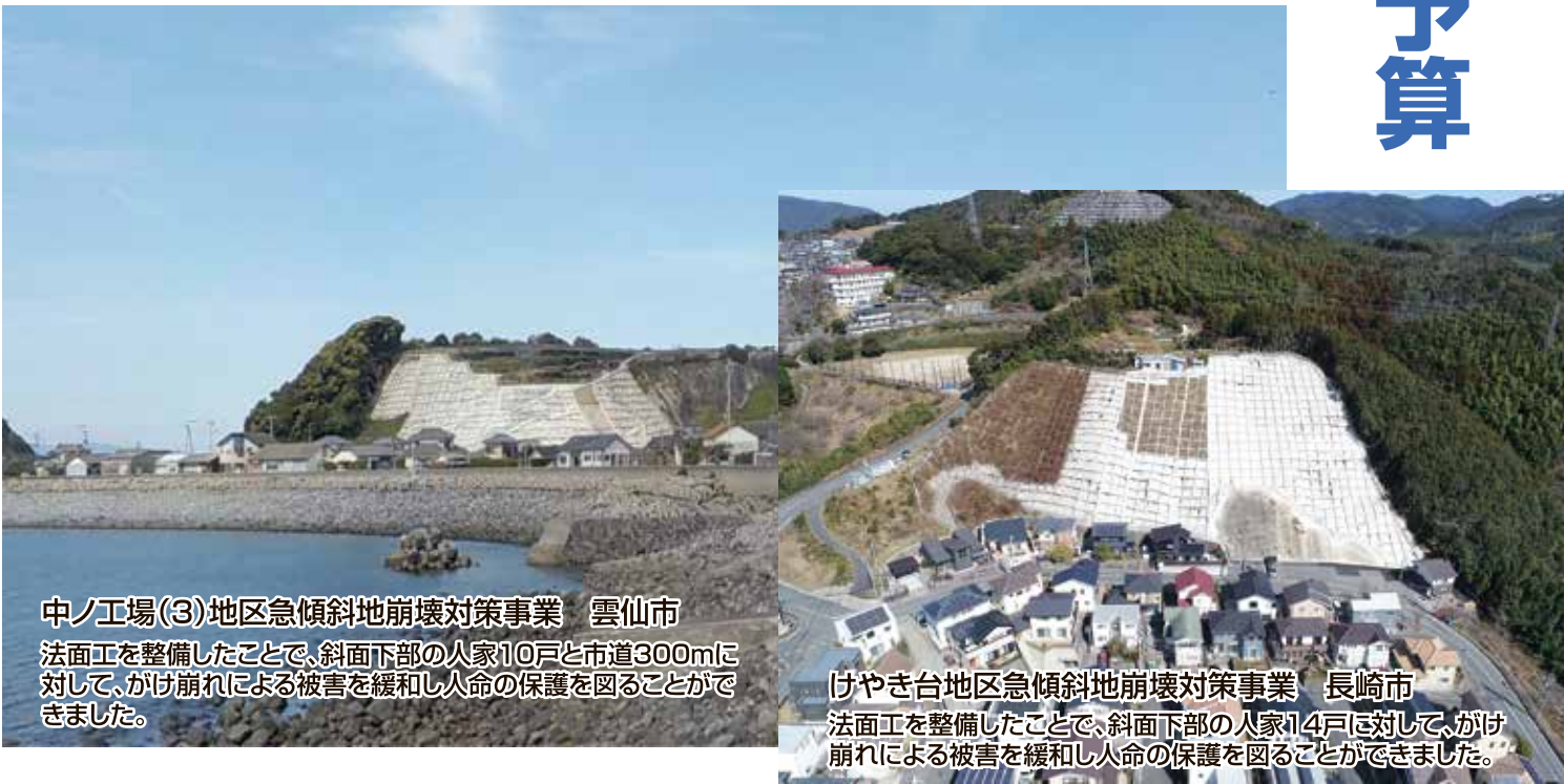
中ノ工場(3)地区急傾斜地崩壊対策事業 雲仙市 法面工を整備したことで、斜面下部の人家10戸と市道300mに対して、かけ崩れによる被害を緩和し人命の保護を図ることができました。