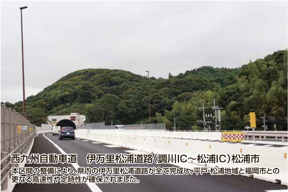
西九州自動車道 伊万里松浦道路(調川IC～松浦IC)松浦市 本区間の整備により、県内の伊万里松浦道路が全て完成し、平戸・松浦地域と福岡市との更なる高速性及び定時性が確保されました。