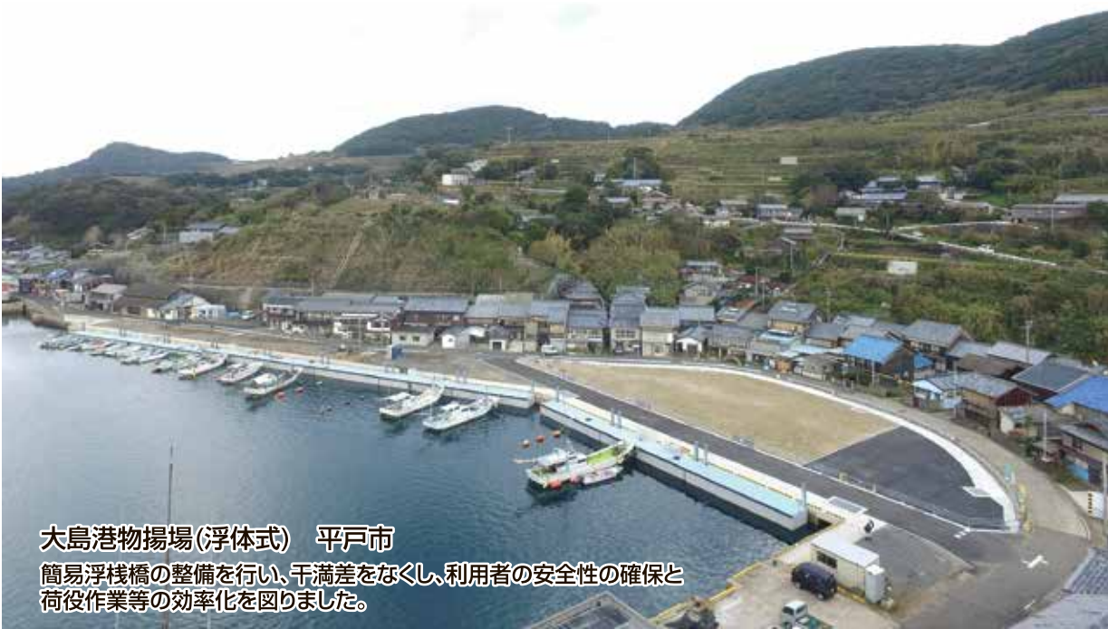
大島港物揚場(浮体式) 平戸市 簡易浮棧橋の整備を行い、干満差をなくし、利用者の安全性の確保と荷役作業等の効率化を図りました。