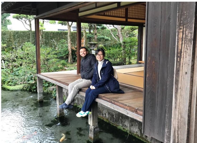
視察研修(島原市・四明荘)