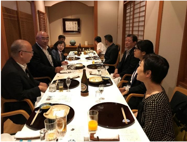
歓迎会(長崎市ホテルニュー長崎)