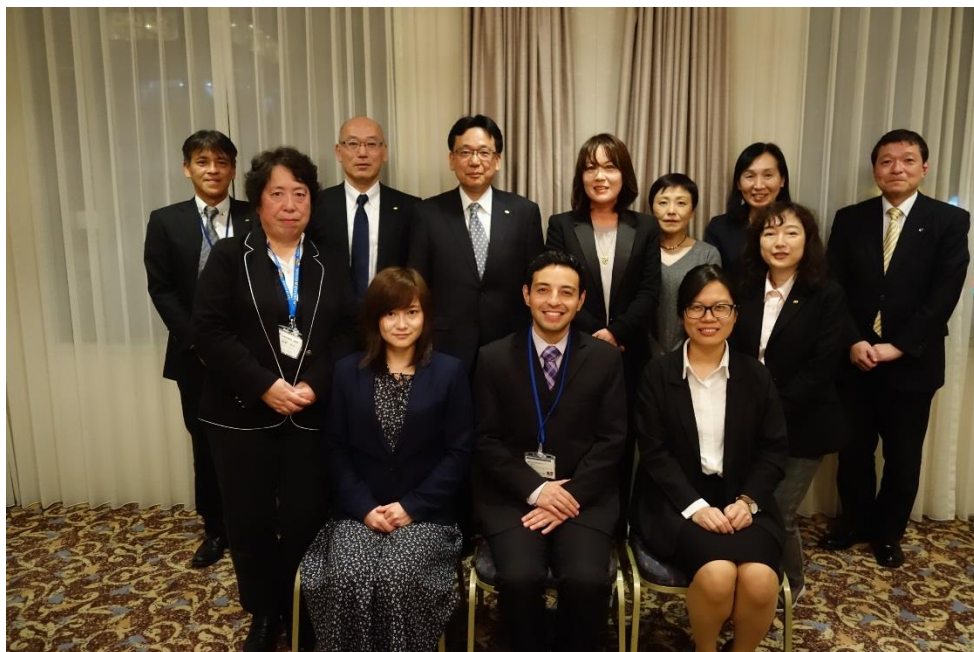
送別会(長崎市・ホテルニュー長崎)