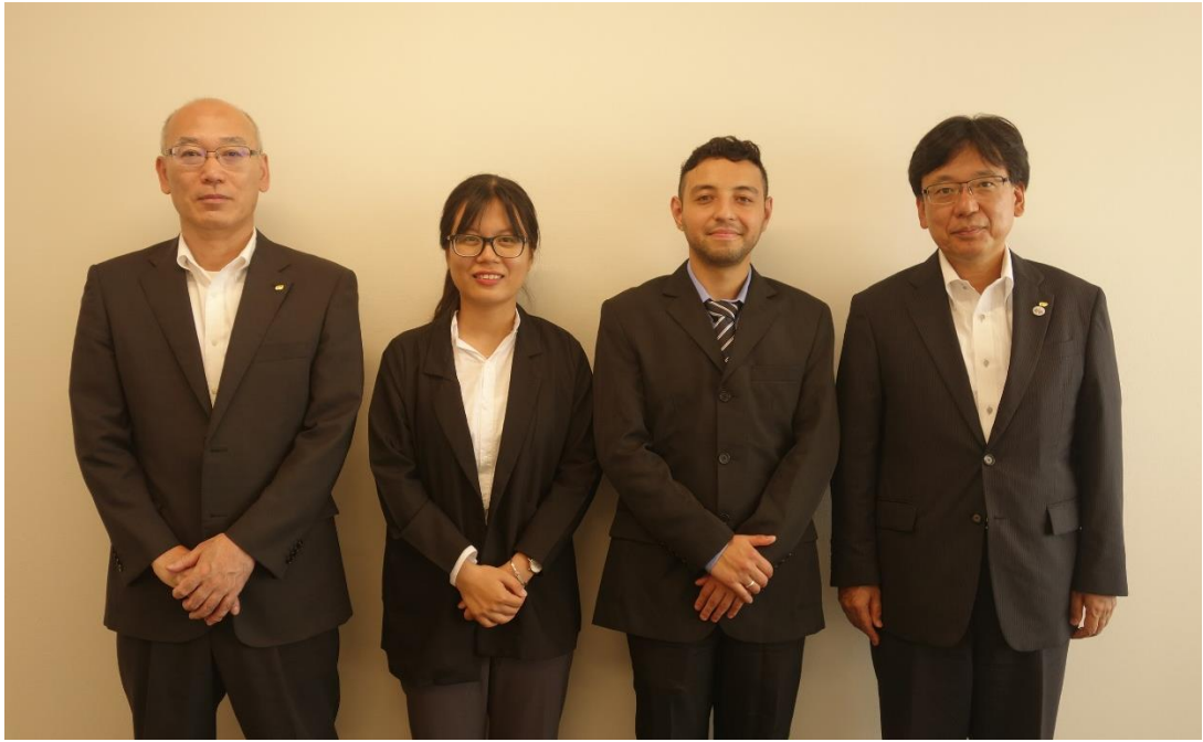
中崎部長表敬(県庁会議室)