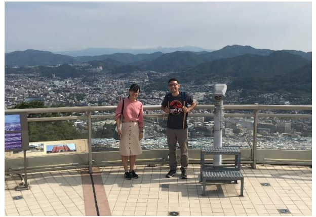
視察研修(長崎市・稲佐山展望台)