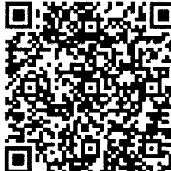
飼養衛生管理基準