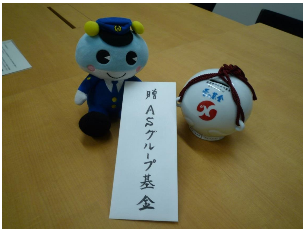
キャッチくん（左）と愛の福祉基金箱（右）