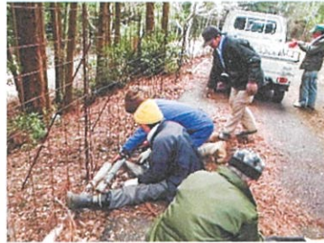
鳥獣防止柵の補強