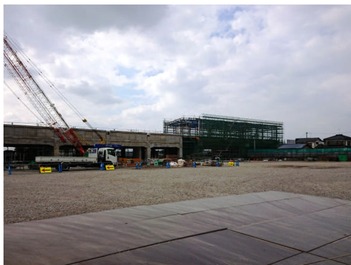
鉄骨組立が始まった新大村（仮称）駅

大村市植松2丁目付近に建設される、新大村（仮称）駅の駅舎新築工事にて、鉄骨を組み立てる工事が1月中旬より開始された。