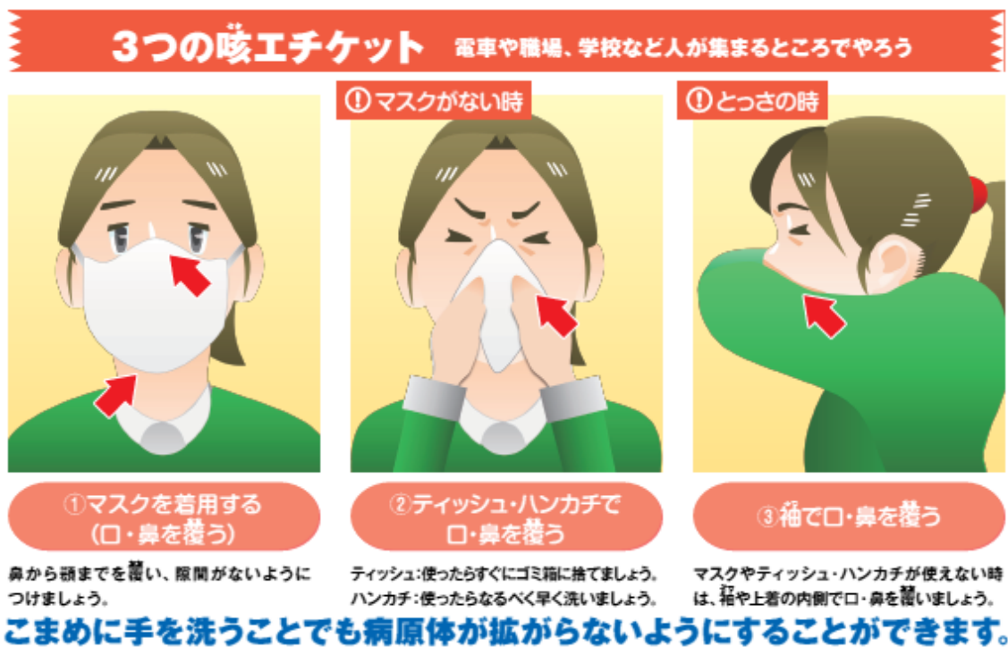
図3 咳エチケットについて