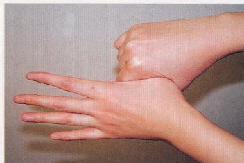
5. 親指と手掌をねじり洗いする