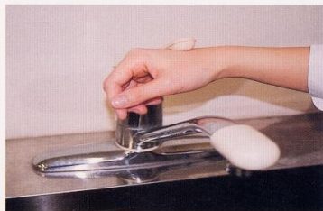
7. 水道の栓を止めるときは、手首か肘で止める。できないときは、ペーパータオルを使用して止める