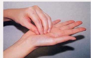
3. 指先、爪の間をよく洗う