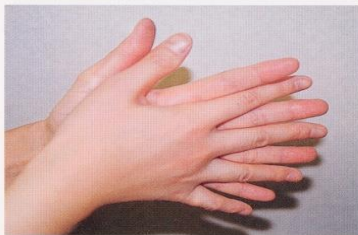
1. 手のひらを合わせ、よく洗う