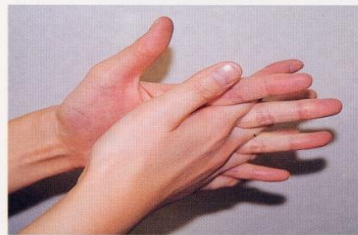
4. 指の間を十分に洗う