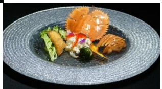
長崎産団扇海老 の冷菜