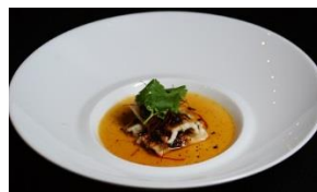
対馬産黄金穴子と 自家製豆腐の 黒豆蒸し