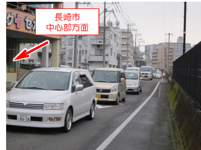
西町交差点付近【朝】