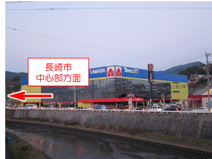
下大橋交差点付近【朝】