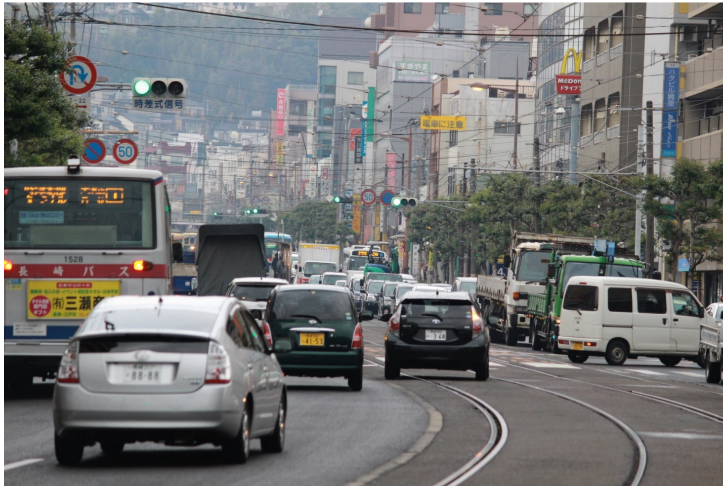
若葉町交差点付近【朝】