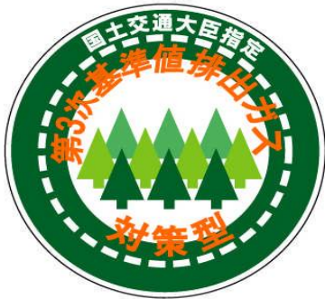
可搬式建設機械の表示