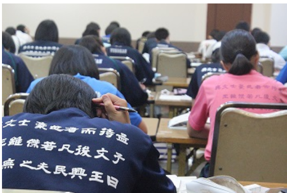
☆3 年生夏の学習合宿(学力を高め合います)

〔設置学科・コース等〕 普通科(各学年 3 クラス)、理数科 (各学年 1 クラス)