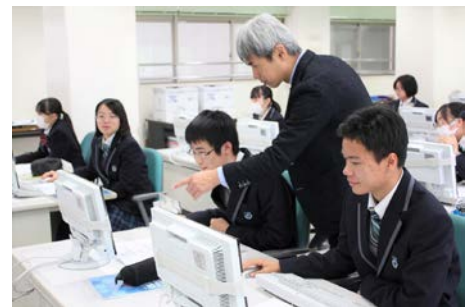
商業科の授業の様子

「目指せ！即戦力」のスローガンのもと、1 年次から商業に関する専門科目を学習し、各種検定の資格取得に力を入れています。また、民間講師招聘事業など、地域に密着した様々な教育活動を行います。経済系の国公立大学にも進学しています。