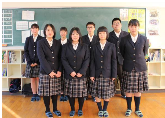
ユネスコスクール部