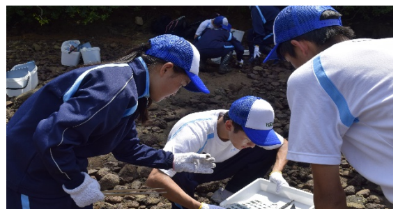
☆理数科1年 (平戸の自然豊かな若宮浦で観察会を体験)

理科や数学を重点的に学ぶ学科で、長崎県北部では猶興館だけに設置されています。複数の大学の研究施設を訪問し、最先端の研究を体験する機会にも恵まれています。また、2 年生になると、関心のあるテーマの探究活動に取り組み、課題を発見し、解決する力が身に付くなど理数系に興味があれば専門性を深めることができるので楽しく学習できるのが最大の特徴です。また、専門の講師による自然体験学習(干潟や山野の動植物観察)も実施し、自らの五感を磨きながら、自己の能力を高めることができます。