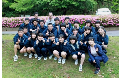
歓迎遠足（クラスの仲間とともに）