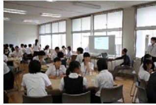
グローバル講演会

4月：新入生宿泊研修（高1：2泊3日） 5月：中間考査 PTA総会 新体カテスト 6月：県高総体 グローバル講演会 7月：期末考査 クラスマッチ（2日） 9月：体育大会 文化祭 中間考査 10月：芸術鑑賞会 11月：県高総体（駅伝） 期末考査 12月：修学旅行（高2：3泊4日） 1月：センター試験（高3） 2月：マラソン大会 学年末考査 3月：卒業式 クラスマッチ（1日） 文化部合同祭 グローバル講演会 海外研修（高1希望者） 医師志望者離島インターンシップ