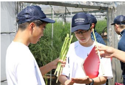
フィールドワーク（アスパラの収穫）

令和元年度から、主に「総合的な探究の時間」を活用した『郷土探究』が始まりました。対馬の抱える課題や魅力に着目し、フィールドワークや地域の方々との連携等を通じ、ふるさと活性化や持続的な発展のための具体的なアイデアを提案することで、郷土愛を深めるとともに課題の克服に向けて主体的に取り組む力を身に付けていきます。