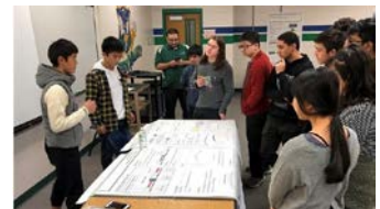
数理探究科 アメリカ海外研修

理科・数学に重点を置いた教育課程です。2年次からは英語・数学の少人数指導や医療系と理工系のコースに分かれた二人担任制などきめ細かな指導を行います。大学や校外の研究施設・医療機関等に出向いての体験的な学習、大学の先生を学校に招いての専門的な講義、自ら設定した課題に挑む課題研究など、恵まれた学習環境の中で、理科・数学の力を深められます。アメリカのグリーンバレー高校での授業参加や課題研究の英語発表など現地の高校生との交流をメインとした海外研修にも参加できます。