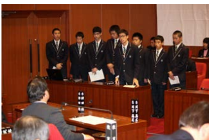
「まつナビ」議会発表の様子

松浦市より補習費・模試代・検定料の補助をはじめ、様々な就学支援が行われています。平成 29 年度からは 2 年生による、松浦市と連携して地域の課題を班ごとに調査・研究し、その解決法を考え、市議会で提言を発表する「まつナビ」という協働教育活動を行っています(本年度から令和 4 年度まで文部科学省の研究指定を受け、1・3 年生も含めた 3 年間の取組となりました)。