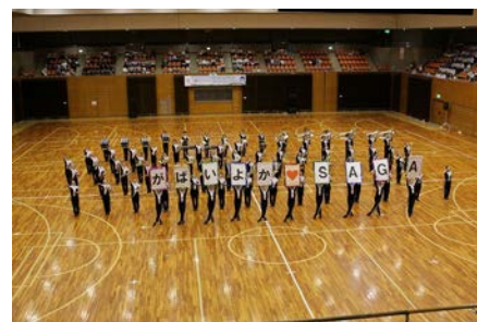
吹奏楽部 (全国高等学校総合文化祭)