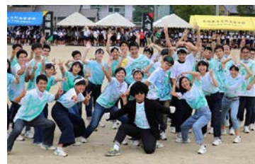
生徒たちで創りあげる学校行事（体育祭）