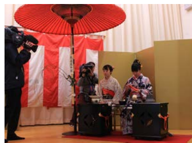
本校の新春恒例行事 初釜