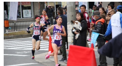
全国高等学校駅伝競技大会

部活動には全校生徒の9割以上が入部しています。体育部は、駅伝競技で、毎年全国大会に出場しています。最近、陸上短距離やフェンシングなども九州大会に出場し、頑張っています。その他、バレー部や野球部も安定して実績を残しています。