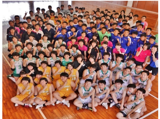
☆高総体を前にして

★文化部：文芸、写真報道、吹奏楽、美術 自然科学、生活科学、茶道、ダンス 以上 21 団体があり、猶興館の生徒は、放課後の生活も充実しています。