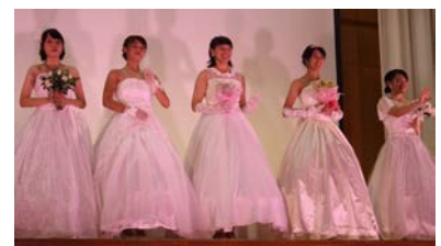
五教祭(文化祭)でのファッションショー

被服や食物、保育や家庭看護、福祉などに関する専門科目を学ぶことができます。また、保育園や社会福祉施設等、校外での実習や、毎年好評をいただいている長崎空港でのエアポートファッションショー、外部の専門家を講師に招いての授業等、体験的な学習も充実しています。進路は、ほぼ全員が大学・短大等の上級学校に進学しています。各種資格取得のための指導にも力を入れており、家庭科技術検定3種目1級(三冠王)の取得数・率ともに九州一で、全国でも一・二を争っています。