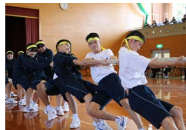
豊高祭(体育祭の部)