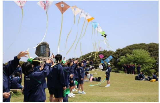
☆歓迎遠足（1年生連凧上げ）