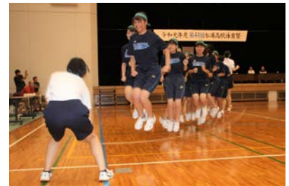
松鵬祭（体育祭）の様子