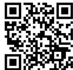
西陵高校ホームページQRコード (学校行事の様子などを掲載しています)

基本的な生活習慣の確立を目的とした予定表付きの手帳である「西陵 milestone」や、3年間の高校生活の手引きとなる「西陵コンパス」などを活用することで自己管理能力を育成し、「学習に軸を置いた部活動との両立」と「人間力の向上」