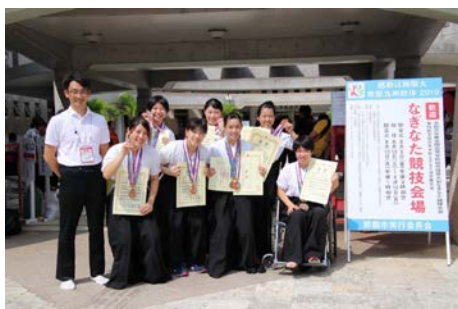
インターハイ3位入賞のなぎなた部

体育部では、県高総体駅伝競技で優勝し、2年連続で全国大会に出場（通算3回目）した陸上競技部、全国高校総合体育大会（インターハイ）で3位入賞を果たしたなぎなた部をはじめ、多くの部が県内の各大会において優れた成績を収めています。