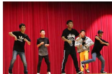
豊高祭(文化祭の部)