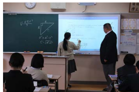
ICT を活用した授業風景