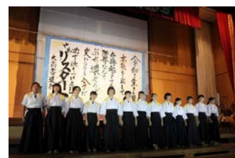
五教祭（文化祭）の一場面（書道部）