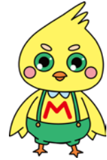
マスコットキャラクター 「まつドリー」

〒859-4501 松浦市志佐町浦免 738 番地 1 号 TEL 0956-72-0141 ・ FAX 0956-72-2896 URL ( http://www.news.ed.jp/matsuura-h/ )