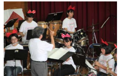
松鵬祭（文化祭）の様子