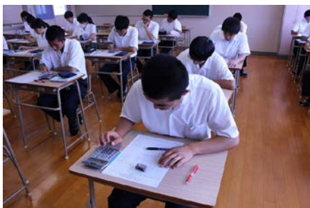
ビジネス基礎 (選択科目)