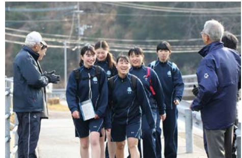
強歩大会（地域の方の激励を受けて）

このキャッチフレーズのもと、教師から生徒へ、生徒から地域へと広がる関わりを大切にする、明るく活気のある学校です。平成 24 年より豊玉高校支援会議が発足し、地域ぐるみで学校の活性化を目指しています。保護者・地域住民の方々に、あいさつ運動、除草作業、強歩大会や餅つきなどで支援をしていただいています。