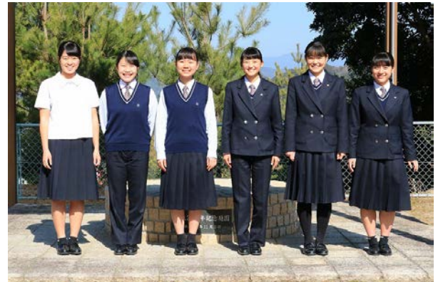
スラックスなど女子制服のさまざまな組み合わせ (衣替えの時期がなく、気候に応じて自由に選択できます)