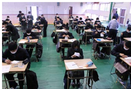
新入生研修「新風」 今年はマスク作りも行いました