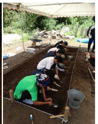
未調査遺跡の発掘