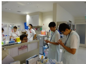
インターンシップ (2年生)