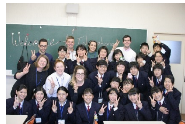
インターナショナルデー

「英語」の授業数が多く STEP 英検 2 級や TOEIC・GTEC の高得点取得を目指します。また、第二外国語として「中国語」(必修)を学習し、2年次からは選択科目として、「韓国語」またはパソコン技術を習得する「情報処理」の選択も可能です。進路は多くの生徒が外国語や国際学部への進学や語学力を生かせる就職を目指します。