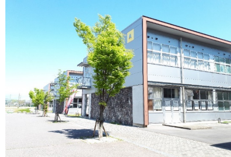
島原工業高校・実習棟