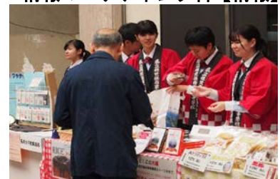
情報マーケティング科【マーケティング】

「発信型外国語教育」実践のための外国語の専門学科です。「読む」「書く」「聞く」「話す」といった4技能をバランス良く育成していきます。日頃の学習活動とイングリッシュセミナー・海外ホームステイなどの行事を通して「英語力」と「コミュニケーション力」を高めます。また、TOEIC高得点や実用英検などを生かした進路実現も果たしています。