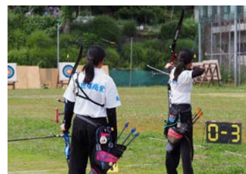
アーチェリー部（女子）

また部活動以外でも、全国商業高等学校協会主催英語スピーチコンテストでは、全国大会で優勝する生徒も輩出し、毎年全国の上位に入賞しています。また、平成28年度には、全国高校生クリエイティヴコンテストにおいて、総合ビジネス科2年生197名で共同制作した、クロスステッチタペストリーが最高賞の文部科学大臣賞にも輝きました。