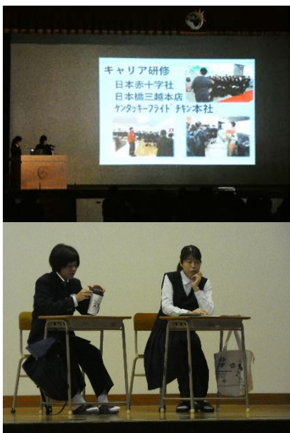
上：創造発表会、下：東翔祭（演劇部）