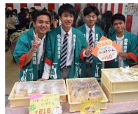
開発商品販売(店舗実習)

ビジネスの基礎・基本を身に付け、企業活動や流通に関する専門的知識と技能を活用して社会に貢献できる人材を育成します。特に、「総合実践」では、他店から仕入れた商品を販売するという小売業の一連の流れを学習することができます。（島商upp）「商品開発」では、地元事業所と連携し、独自商品の開発を目指します。また、日商簿記検定や秘書検定など、様々なビジネス系資格に挑戦することができます。