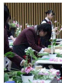
フラワーデザイン コンテスト