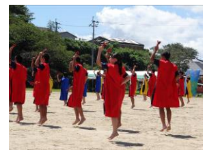
城南よさこい(体育祭)

また、1年次「産業社会と人間」では「発見する」、2年次「総合探究」では「知る」、3年次「課題研究」では「表現する」というテーマを掲げ、キャリア教育を深め、希望の進路実現を目指しています。