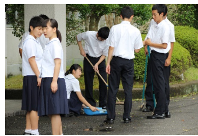
オンリーワン長崎明誠活動 (6月)