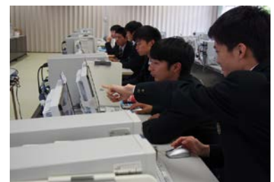
情報マーケティング科【情報】

2年次よりマーケティングコースと情報コースを選択します。マーケティングコースでは、マーケティング・商品開発などに関する知識や技能を授業や体験的学習を通して学びます。情報コースでは情報活用能力の育成を主な目的に学習を行います。両コースとも卒業後の進路選択や学習活動をより充実させることを目的に、より高度な資格取得にも力を注いでいきます。