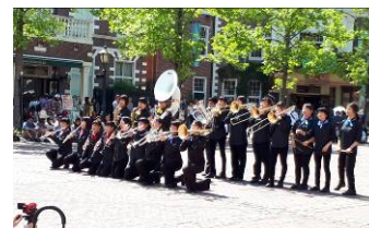
吹奏楽演奏 (HTBマーチングバンド)