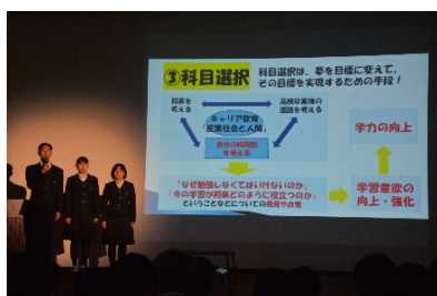
長崎明誠発表会 (2月)