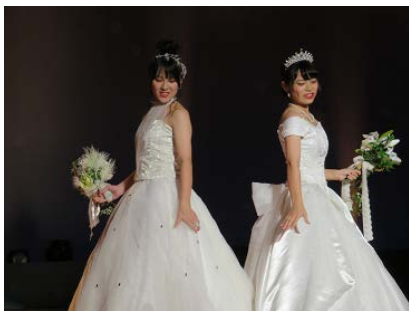
文化祭(清羅祭) ファッションショー