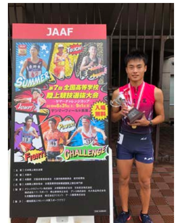
全国高校選抜陸上競技大会

文化部・体育部とも各種大会での上位入賞を目標に、活気に満ち溢れた活動を行っています。