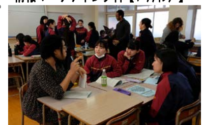
国際コミュニケーション科