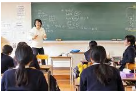
韓国語の授業の様子

対馬での生活は、下宿または寮で送ります。下宿では里親さんが、寮では高校の先生が安心できる高校生活をお手伝いします。