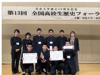
全国高校生歴史フォーラム

奈良大学で開催されている全国高校生歴史フォーラムに出場しています。全国から応募される100以上の研究成果の中から五つの論文が優秀賞として選出されます。毎年一つの研究テーマにチームで取り組み、令和元年度は特別賞（全国3位）という快挙を成し遂げました。