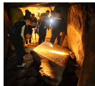
島内巡検(鬼の窟古墳)

国内に62件しかない史跡の国宝にあたる国指定特別史跡の原の辻遺跡を筆頭に、280を超える古墳や1,000社ともいわれる神社・祠、また元寇の戦場跡や秀吉の命により築造された勝本城跡など、壱岐は歴史を学ぶ場としては最高の環境です。日々の授業の中で島内史跡を巡検し、歴史学の知識を身に付けていきます。