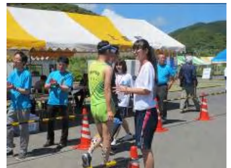
ボランティア参加