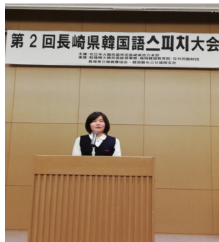
コンテストに出場