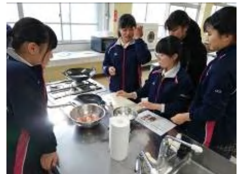
出張講義（韓国料理）

他にも韓国の専門家による出張講義や韓国の大学生・高校生との交流会などがあります。