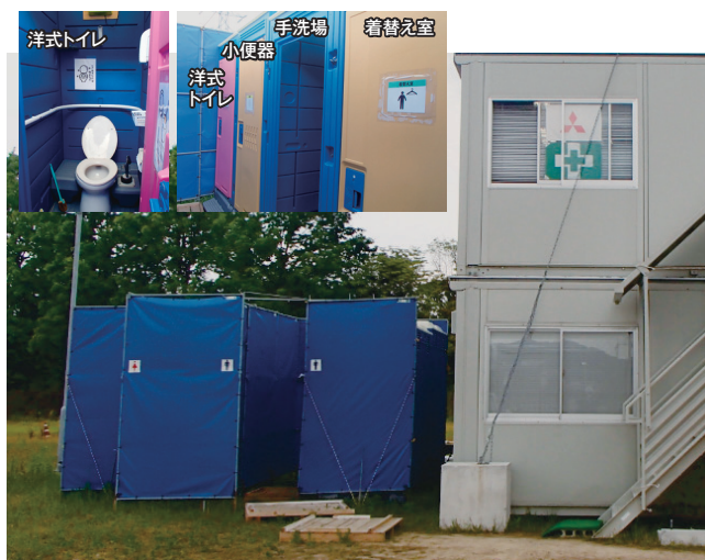
～「快適トイレ」の一例～