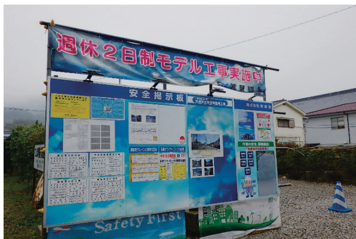
～「週休2日」取組の掲示状況～