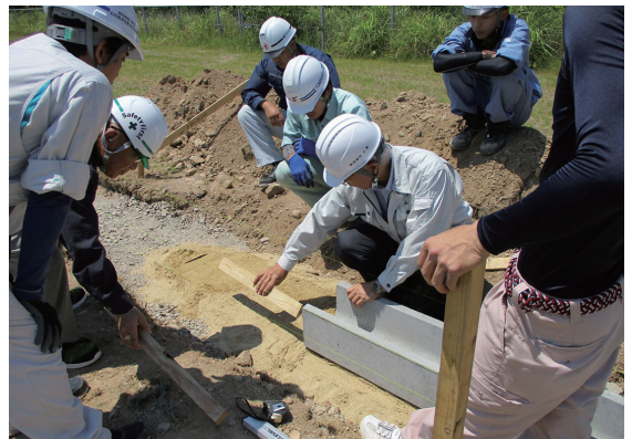
～土木施工管理基礎研修の様子～