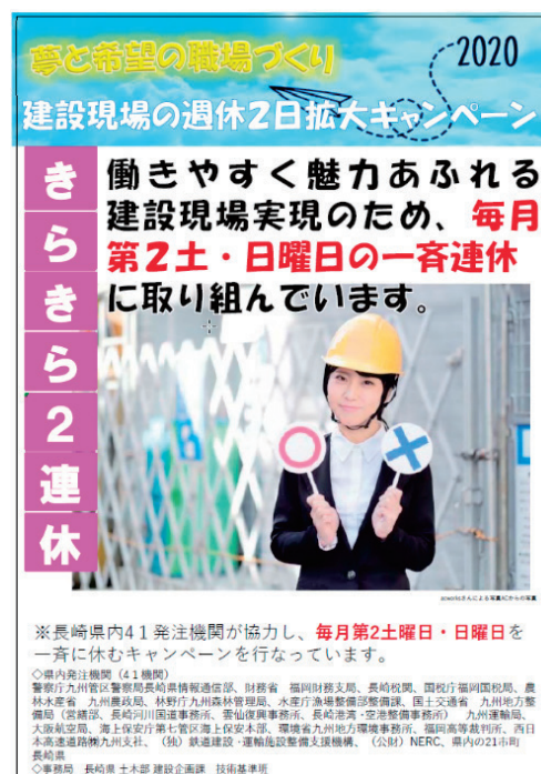
～「きらきら2連休」チラシ～