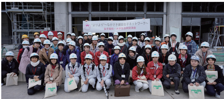
“よりより”～ながさき建設女子ネットワーク～ 女子高校・大学生合同交流会