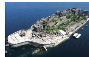
端島炭坑(通称:軍艦島)(長崎市)