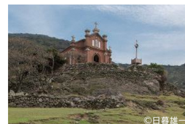
野崎島の集落跡(小値賀町)

長崎県と熊本県天草市に点在する12の構成資産からなる一群の遺産です。16世紀にキリスト教が日本へ伝来後、17~19世紀に江戸幕府によって禁教政策が行われました。その間もひそかに信仰を続けた「潜伏キリシタン」が、各地で厳しい生活条件の下に、既存の社会・宗教と関わりながら独特の文化的伝統を育んだことを物語る貴重な証しです。