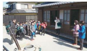
頭ヶ島の集落で学習する子どもたち