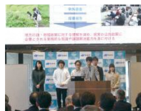
県内大学生による発表

企業・団体や市町と共に「世界遺産保存活用県民会議」を構成しており、今年2月には、県民の皆さんが取り組んだ活動を発表するイベントを開催しました。