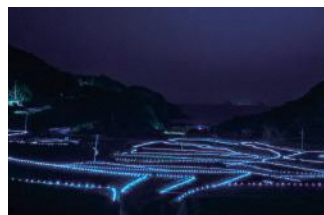
春日集落の棚田ライトアップ

構成資産のある集落の保護活動を活性化するため、各市町の取り組みを支援しています。春日集落(平戸市)では、棚田のライトアップやスタンプラリーの実施によるにぎわいの創出のほか、漫画を活用した情報発信、土産品の販売による活動資金の確保に努めています。また、久賀島の集落(五島市)では島のファンを増やすためにウェブサイト「久賀島ライフ」で島の魅力を発信し、頭ヶ島の集落(新上五島町)では将来の担い手となる子どもたちが世界遺産について学ぶ機会をつくっています。