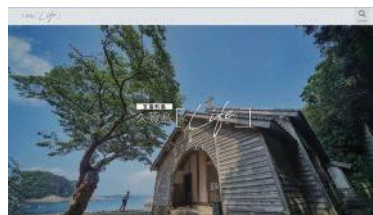
ウェブサイト「久賀島ライフ」