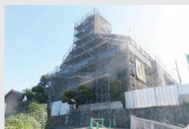
修復工事中の黒島天主堂(佐世保市)