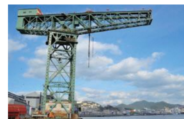
ジャイアント・カンチレバークレーン(長崎市)※非公開

19世紀半ば以降、封建時代の日本が欧米からの技術移転を模索した過程や、導入した技術をどのように国内のニーズや社会的伝統に適合させたかを示し、西洋から非西洋国家に初めて産業化が広がったことを表しています。県内には長崎市に8つの構成資産があります。