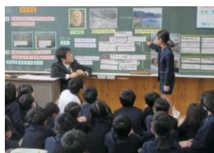
世界遺産についての授業

県内の小中高校生に、世界遺産としての価値やその魅力を知ってもらい、ふるさとに愛着や誇りを持ってもらう取り組みを進めています。